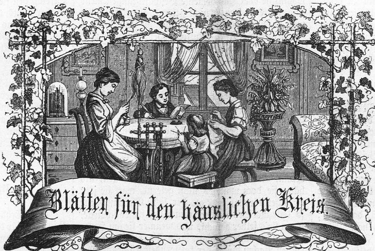
Motto: Immer strebe zum Ganzen; — und damit Du selber ein Ganzes werden, Als dienendes Glied schliesse dem Ganzen Dich an.