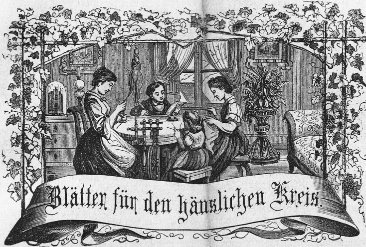
Motto: Immer strebe zum Ganzen; — und kannst Du selber kein Ganzes werden, Als dienendes Glied schließe dem Ganzen Dich an.