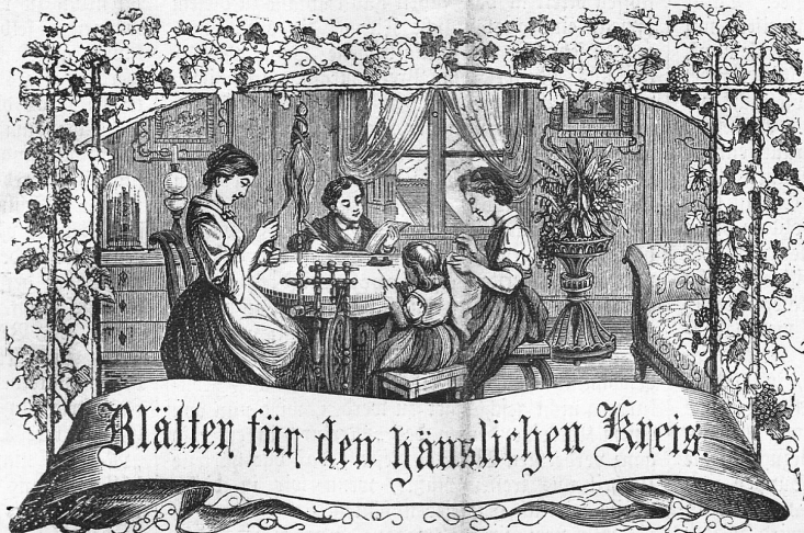
Motto: Immer strebe zum Ganzen; — und kammst Du selber kein Ganzes werden, Als dienendes Glied schliesse dem Ganzen Dich an.