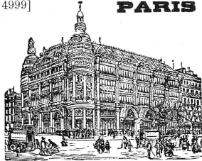
GRANDS MAGASINS DU