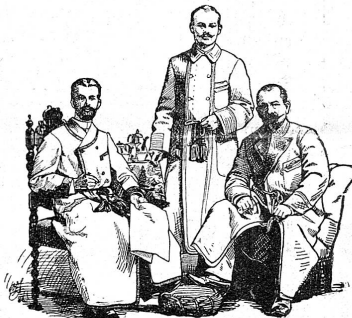
Façon 1. Façon 2. Façon 3.

werden Dr. J. J. Hohl's Pektorinen , ein seit 30 Jahren anerkanntes Hausmittel ersten Ranges, ernsthaft empfohlen. Diese Tafelchen mit sehr angenehmem Geschmacke sind in Schachteln zu 75 und 110 Rp. ächt zu beziehen durch sämtliche Apotheken in St. Gallen und Herisau, durch die Apotheken Siegfried in Kappel, Dreiss in Lichtensteig, Helbling in Rapperswil, Rothenhäuser in Rorschach, Streuli in Uznach, beide Apotheken in Frauenfeld, v. Murat in Bischofszell, sämtliche Apotheken in Winterthur, Glas-Apotheke in Schaffhausen, Eidenbenz & Stürmer in Zürich, Goldene Apotheke in Basel, sowie in den durch die Lokalblätter genannten Niederlagen. (H 3780 Q) [957]