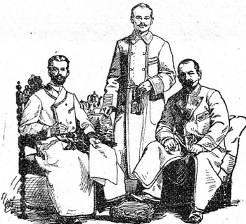
Façon 1. Façon 2. Façon 3.

empfiehlt sein frisch assortirtes, überaus reichhaltiges Lager in allen möglichen Genres Tuchwaaren , besonders englischer und belgischer Fabrikation, in billiger und doch solider Qualität, ebenso Flanellen , sowie wasserdichter Loden , in Winter-, halbschwerer und Sommerwaare . Militär- und Livrée-Tuche und Westenstoffe . Um vorgekommenem Missbrauch für die Zukunft vorzubeugen, wird eine verehrliche Kundschaft darauf aufmerksam gemacht, dass jede einzelne Musterkarte meine Firma trägt. (O F 1160) [238]