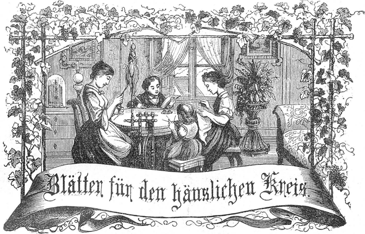
Motto: Immer strebe zum Ganzen, und kannst du selber kein Ganzes werden, als dienendes Glied schlies an ein Ganzes dich an!

Organ für die Interessen der Frauenwelt.