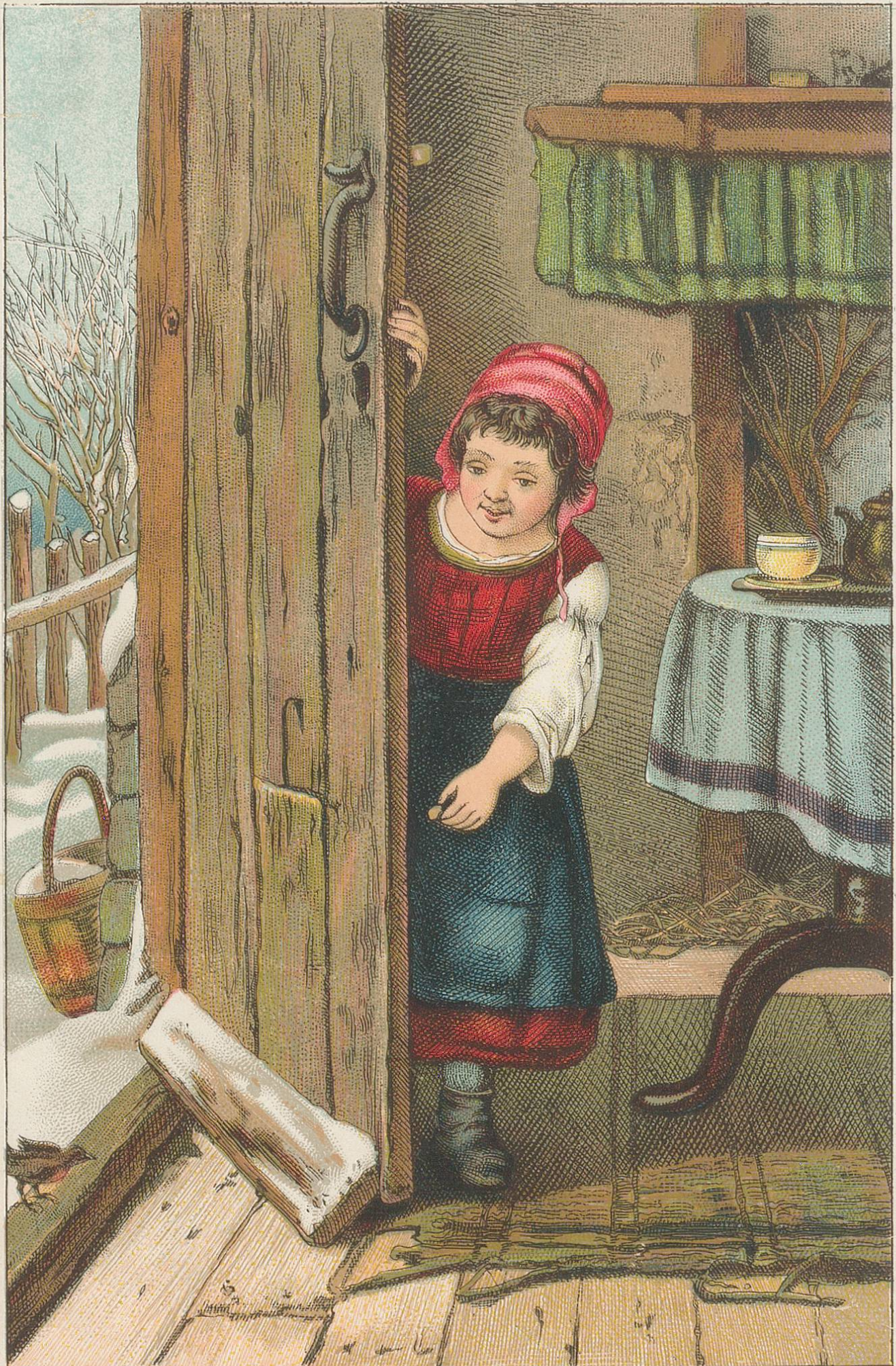
Der erste Besuch am Neujahrsmorgen.