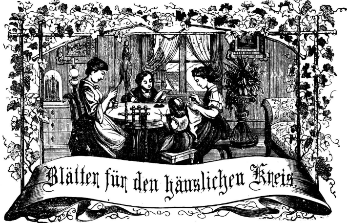
Motto: Immer strebe zum Ganzen, und kannst du selber kein Ganzes werden, als dienendes Glied schlies an ein Ganzes dich an!

Insertionspreis. Per einfache Petitzeile: 20 Cts. für die Schweiz, 20 Pf. für das Ausland. Jahres-Annoncen mit Rabatt.