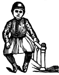
I DON'T Einst.

Vorzügliches Mittel, alle ähnlichen Produkte an Wohlgeschmack und Wirkung übertreffend von vielen Aerzten empfohlen gegen: SKROFULÖSE LEIDEN DRÜSENGESCHWULSTE. HAUTAUSCHLÄGE, BRUSTSCHWÄCHE, ALLGEMEINE SCHWÄCHE DER KINDER. U S W