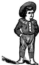
I WEAR THEM Jetzt

Schwache Knöchel bleiben gerade und krumme werden gerade in F. Beurers Schwachknöchel-Schuhen.