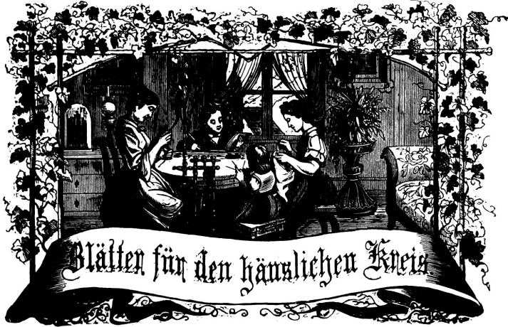
Motto: Immer freie zum Gange, und kannst du selber kein Gange werden, als dienendes Glied schliesst an ein Gange dich an!

Organ für die Interessen der Frauenwelt.