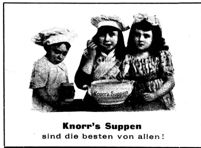
Knorr's Suppen sind die besten von allen!