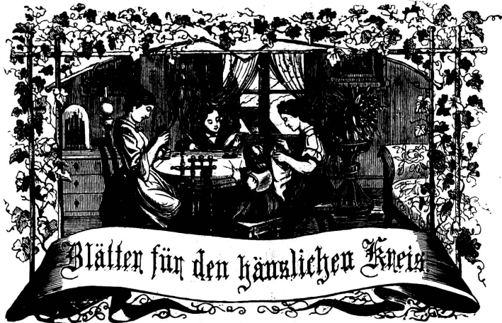
Motto: Immer frohe zum Gange, und kennst du selber kein Ganges Herben, als dienendes Geschicklich an ein Ganges dich an!

Abonnement. Bei Franco-Zustellung per Post: Jährlich . . . . . Fr. 6.— Halbjährlich . . . . . „ 3.— Ausland franco per Jahr . . . . . „ 8. 30