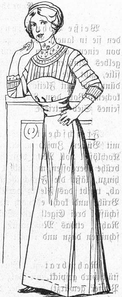
Fig. 7. Einfaches Kleid aus zweierlei Stoff (Rock u. Mieder aus Tuch, Taille aus Tüll).

Der Sommer dürfte uns viele fragenlose Taillen bringen, zu denen ein Umlegen von plissiertem Linon und ebensolche Ärmelaufschläge getragen werden sollen. Wir gehen den Vingerietragen und Manschetten in den verschiedensten Ausführungen entgegen, die bei keinem Kostüme fehlen werden. — Krawatten, Sabots, Rabats, kurz alle weißen duftigen Ergänzungen unserer Toilette wird die Mode wieder