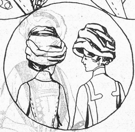
Fig. 4. Rückansicht zu Fig. 2.