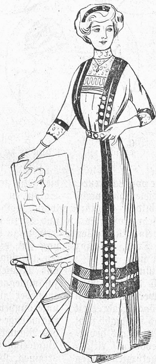
Fig. 1. Kleid in Kussenform aus Wollstoff mit Treppenbesatz.

Der große Turban aus altem verblaßtem Seidenbrokat, aus Metallstoffen auf das ungeheuerlichste drapiert, mit riesigen Nigretten, dichten Federtuffen verziert, der Turban, aus zweifarbigen Seidenmusselin oder Tüll gedreht und mit voluminösen Rosen garniert! Und natürlich der Turban aus Strohgeflecht und Bast (Abb. 2 und 3). — Brauche ich