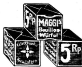
Bouillon - Würfel