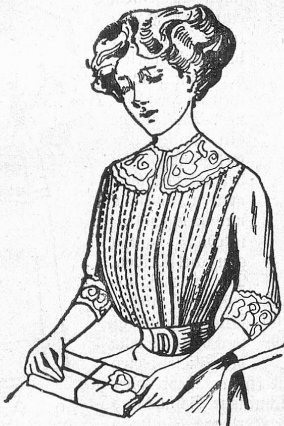
Fig. 1. Moderne Kimonobluse mit Saumschmuck und Spitzengarnitur.

Die Farbenfreudigkeit betonen auch die bunten Balmenmusterungen der Kaschmirschals. Daß man die allzu bunt wirkenden Stoffe durch „Verschleierung“ zu dämpfen sucht, tut ihrer Farbigkeit wenig Eintrag, gibt jedoch den Toiletten einen ganz entzückenden Charme, ein geheimnisvolles