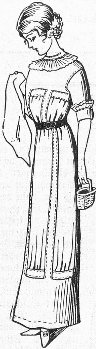
Fig. 2. Einfaches Wasch- oder Musselinkleid mit modernem engem Rock.

mehr denn je der Vergleich mit einem Tulpenbeet anzuwenden, ist doch die Modedame tatsächlich wie eine langstielige Tulpe geformt mit ihrem nach unten sich stark verengenden Rock, der nach der Meinung der Schneiderin mit 140 Centimeter reichlich weit genug sei, um darin gehen zu können.