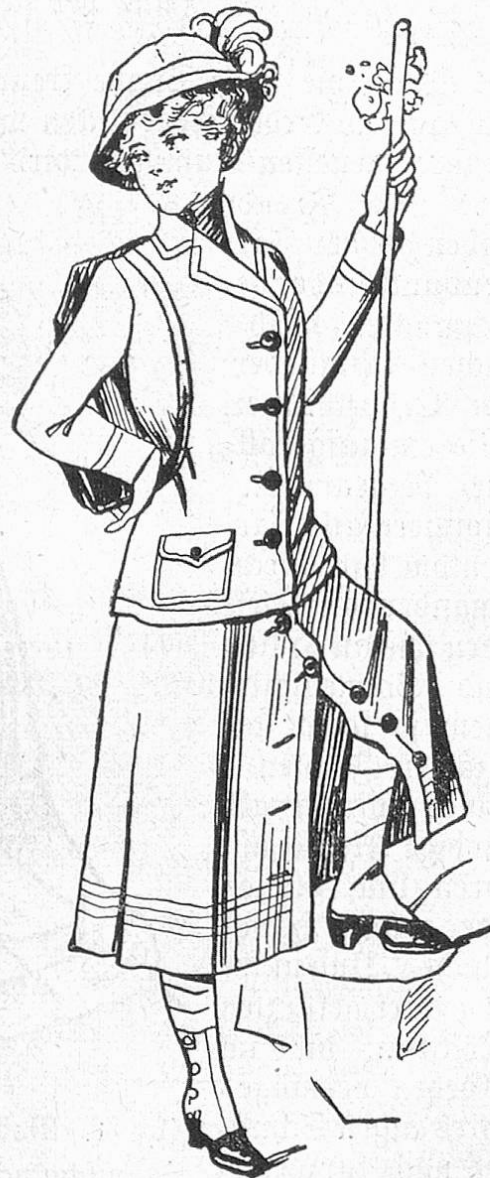
Fig. 3. Praktischer Anzug für das Hochgebirge.

Raumberbrauch und die weichen Stoffe so schmiegsam und unzerdrückbar, daß schon in einem einfachen Handkoffer mehrere vollständige Kleider mitgenommen werden können. Das gleiche gilt von der Unterkleidung, bei der die reichgarnierten weißen und farbigen Unterröcke nahezu ganz ausscheiden. Die feine Batistwäsche ist gleichfalls so schmiegsam, und an Stelle der Stiefel treten