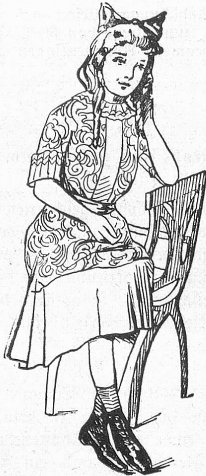
Fig. 4. Modernes Kinderkleid aus zweierlei Stoff.

Zum Bergsteigesport, zu größeren Wandertouren im Gebirge bieten wir mit Abbildung 3 eine gut ausprobierte Vorlage. Es genügt nicht, einen wetterharten Stoff für das Kostüm