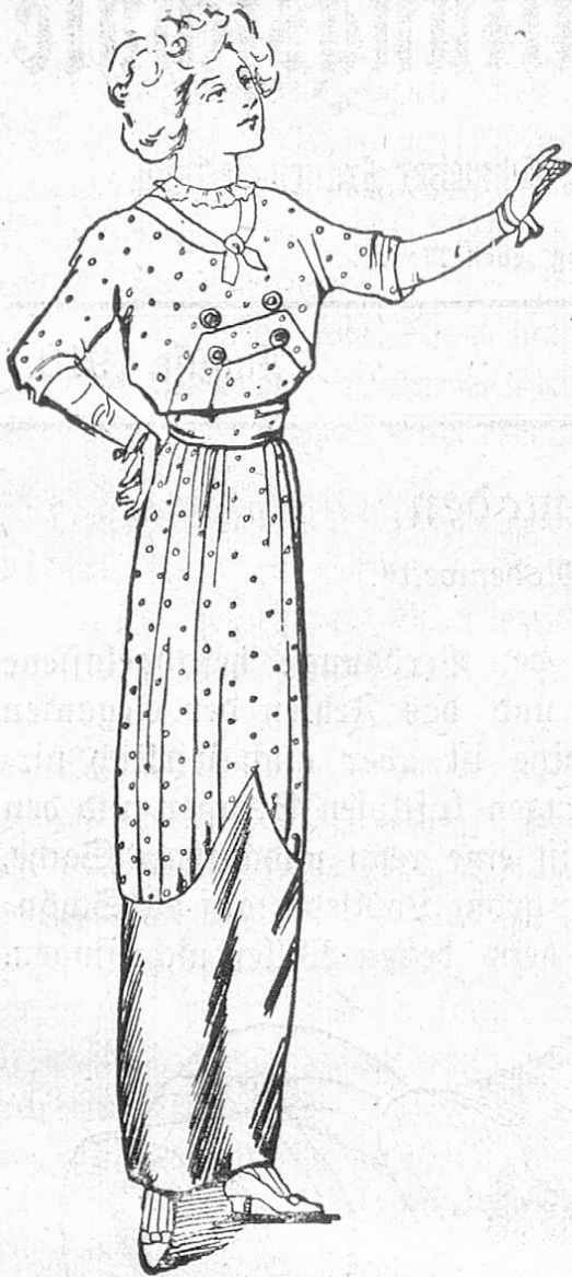
Fig. 3. Eine Toilette vom modernsten Schick.

lassen Revers und Manschetten das abstechend farbige Futter sehen, das Eleganteste sind jedoch die Kostüme aus rabenflügelblauem großgewässerten Moiré im schlichsten Schnitt, ohne irgendwelche Steppnähte, mit großen Knöpfen aus dem gleichen Stoff. Von dem Schick einer solchen Toilette kann man sich schwer einen Begriff machen, wenn sich ihr noch ein großer schwarzer Hochhaarhut mit glockenförmiger Krempe gesellt, dessen