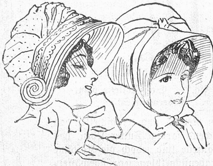
Fig. 1 und 2. Autohüte, die die kommende Hutform haben.

Die ausschweifendste Phantasie eines Humoristen könnte keine eigenartigere Silhouette malen als die der streng modern in ein Tailor made gekleideten Frau, wenn sie sich mit trippelnden Schritten durch