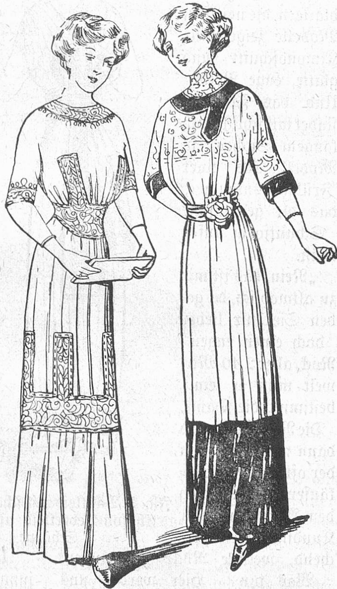
Fig. 1 u. 2. Zwei moderne, elegante Kleider.

Die Modenzeitungen können heute viel besser wie in früheren Zeiten die Stimmung des Publikums gegenüber der Mode beurteilen; durch die Neuerung, die sie durch Schaffung ihrer AuskunftsSalons getroffen haben, sind sie in persönliche Verbindung zum mindesten mit ihren Berliner Leserinnen getreten. Hier sitzen die Damen gemütlich um den Kieistentisch mit den „klugen Büchern“, in denen