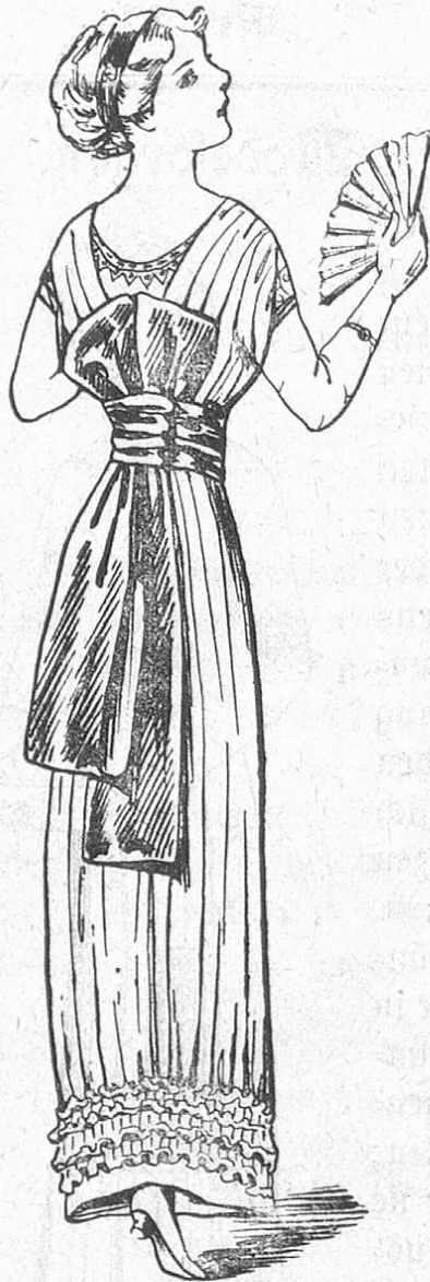
Fig. 3. Ballkleid mit scharfgrünem Chiffon-Überkleid und neuer Schärpe.

rock einen Faltenwurf aufweisen müsse. Für eine glatt den Unterkörper umspannende Röhre genügt ja schon ein noch viel geringerer Umfang als zwei Meter. Und wenn man nicht schreiten kann, so trippelt man, und wenn auch dies nicht möglich ist, so gibt es ein ganz vorzügliches Mittel, den Füßen mehr Bewegungsfreiheit zu schaffen. Man rundet den Rockrand vorn und hinten stark nach oben aus, das gibt eine völlig neuartige Form und ist tatsächlich die einzige Möglichkeit, den Rock zu erweitern, ohne daß er seine gewünschte Faltenlosigkeit einzubüßen braucht.