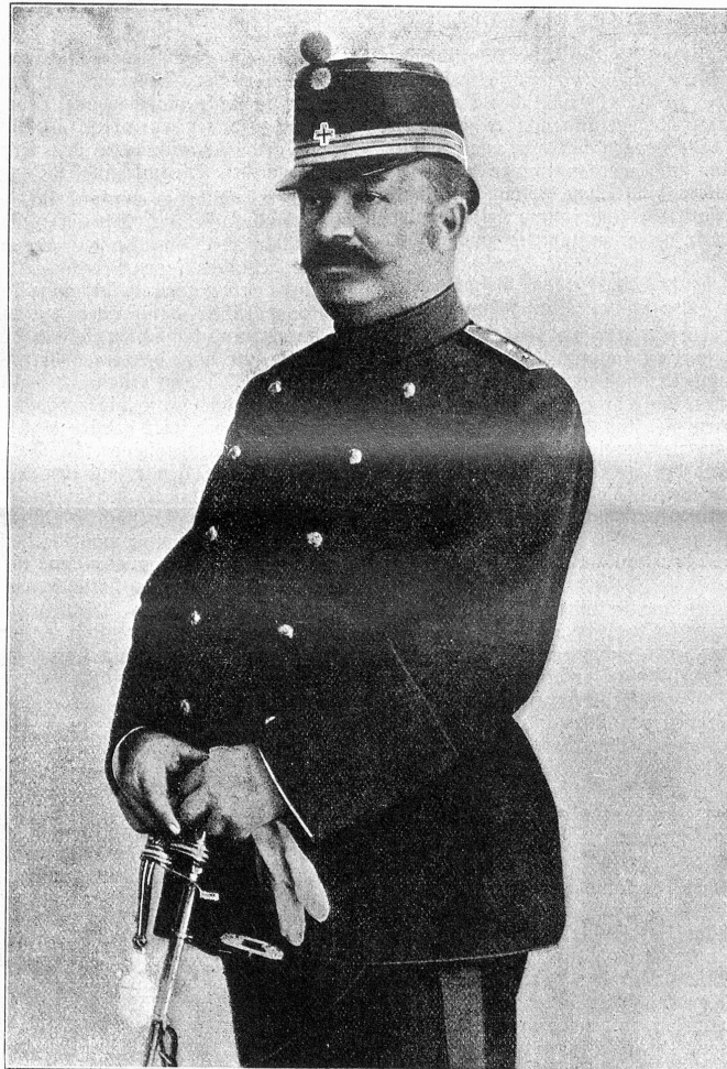
Oberst Ulrich Wille, Kommandant des III. Armeekorps.

Peter und Paul! Der feierliche Tag der Schutzpatrone, der ausschließliche Erwählten für das