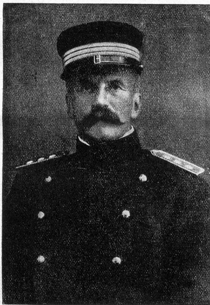
Oberst Isaat Iselin, Kommandant des 2. Armeekorps.

Am Schützenstand knallt es bis zur einbrechenden Dunkelheit, und um den aufgerich-