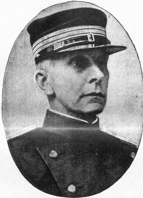
Oberst Sprecher von Bernegg Chef des schweizerischen Generalstabs.

Einjam und verlassen all die Stätten, worin die Müden ruhen im ewigen Schlaf. Die feierliche Stille durchbrach scharf und schrill das Sauchzen der Fiedel, das rohe, aufbringliche Brummen des Basses. Wie erschrocken stüchteten sich die kleinen Vögel ins dichtere Gezweig, und die weißen Lilien auf dem schönsten aller Gräber schienen zu erbeben auf ihren schlanken, hellgrünen Stengeln. Sie schwankten hin und her, und zwischen ihnen leuchteten goldene Worte auf weißgrauem Stein: