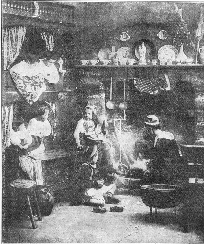
Weihnachtsmorgen in einem Bauernhof in der Bretagne.

Sie ließ die Hände sinken und erhob zu ihm den Blick, in dem eine unlagbare Angst sich verriet. „Was führt dich zurück?“ fragte sie. „Ich habe dich längst nicht mehr unter den Lebenden geglaubt —“ (Fortsetzung folgt).