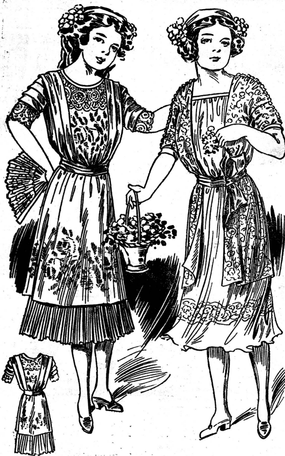
1356. Canzkleid aus rosa Pongeeide mit Ueberkleid aus dreifachtem Chiffon für Mädchen von 12—14 Jahren.

Es ist auffallend, wie sehr der Wille der Frauen die Mode in ihren Neuerungen beeinflusst. In jeder Uebergangssaison wird uns mit sensationellen Umwälzungen „gedroht“, scheinbar nur, um die Stimmung der Damen für oder wider den betreffenden Neuling zu erfordern und um dann rasche einzulernen und entgegenzukommen, bis schließlich die gefährdete Umwälzung in so milder Form und so annehmbaren Grenzen, wie nur denkbar, auftritt. So hat man sich jetzt völlig mit den gefährdeten Drapierungen, Paniers und Raffungen ausgedöhnt, da man ja unbeschadet seiner Eleganz nicht mitzumachen und anzunehmen braucht, was nicht gefällt. Von einem einseitlichen Stil ist darum bei den verschiedenen Toiletten, die man jetzt überall zu sehen Gelegenheit hat, nichts zu bemerken. Aus dem Wunsche, den Vorschriften der Mode zu folgen und dennoch zugleich die allen so liebgeordnete schlanke Linie nicht preiszugeben, ist etwas entstanden, was anscheinend im eigentlichen Modeprogramm nicht vorgesehen war. Man bemüht sich, die Drapierungen mit so wenig Stoffaufwand als nur irgend möglich herzustellen, und nimmt man oben wirklich einen Anlauf zu stofflicher Fülle, so hält man sich dafür um die Füße herum wieder durch