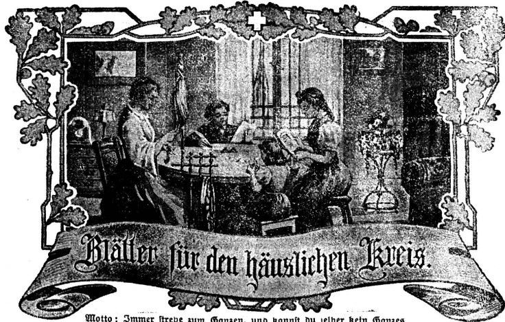
Motto: Immer strebe zum Ganzen, und nimmst du selber kein Ganzes Werden, als dienendes Glied schließ an ein Ganzes dich an!