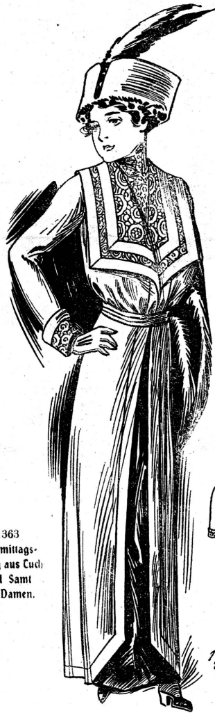
1363. Nachmittagsanzug aus Tuch und Samt für Damen.

mit Ausnahme kleiner Garniturbeigaben, dunkle Farbengebung. Der Stoff ist glatt gehalten und allenfalls durch gerabefaltende Falten erweitert. Unter den vielen Jackenformen erscheint als Neuheit eine halb lange lose Jacke, die durch einen Gürtel mit Schnalle zusammengehalten wird. Neuartig erscheint auch die durch eine breite Binde aus Samt oder Plüsch, zuweilen auch aus Noiree verlängerte Jacke, die man sich zur Wobereinführung vorjähriger kurzer Jacken ad notam nehmen kann. Um leichtere Kostüme auch für strengeres Winterwetter brauchbar zu machen, nimmt man die Mode, Westen aus dem Stoff des Kostüms zu tragen, gern an. Zu eleganten Reisekostümen mit halb offener cutaway-Jacke wird gleich eine pelzbesetzte Weste aus dem gleichen Stoff gearbeitet, deren Rücken auch aus demselben Stoff ist, und wenn man will, gibt man ihr auch Vernet. Ein anderes Plüsmittel gegen zu leichte Jacken hat man in den bekannten Lederwesten, die aber gewöhnlich keine Vernet haben.