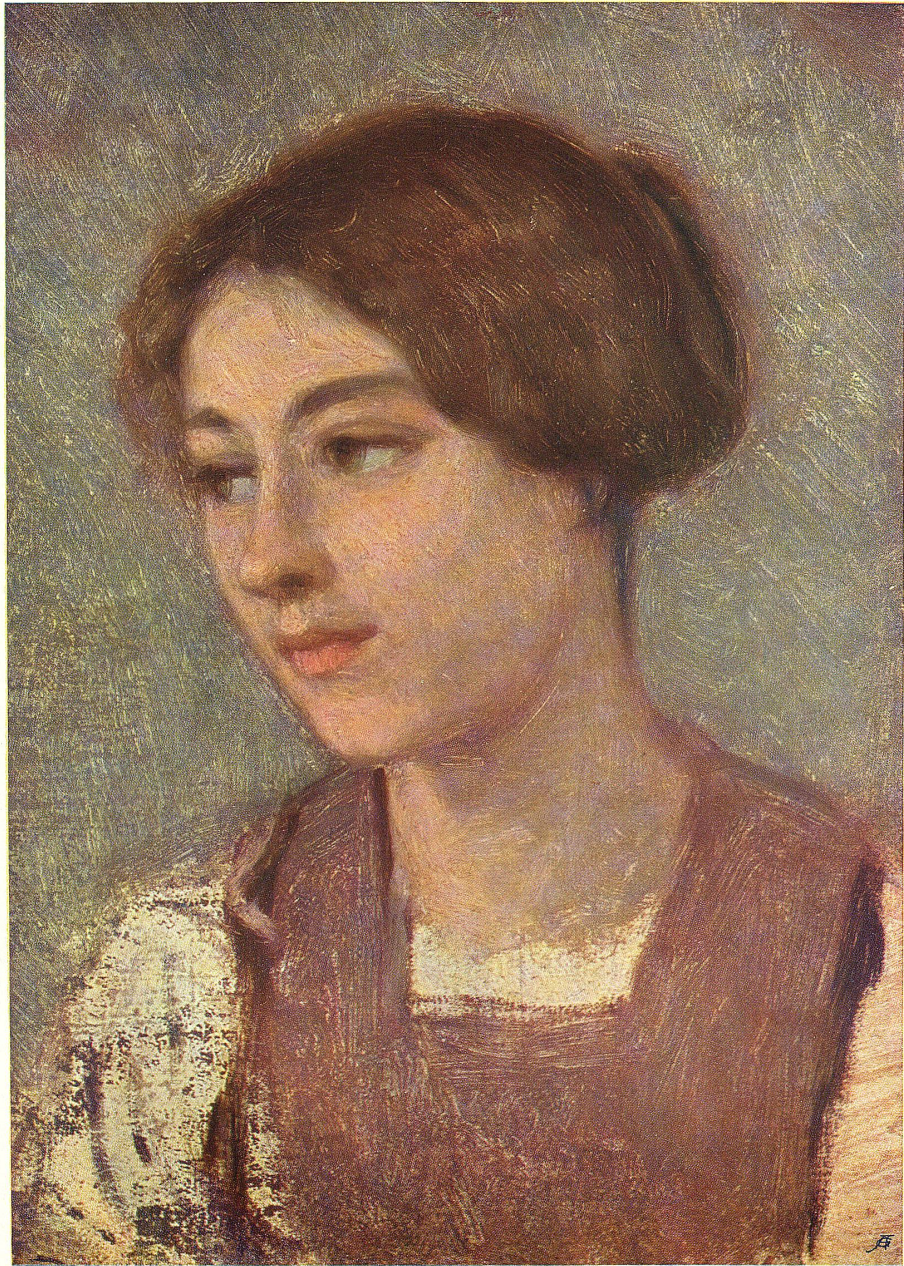
E. Rittmeyer, pinx.