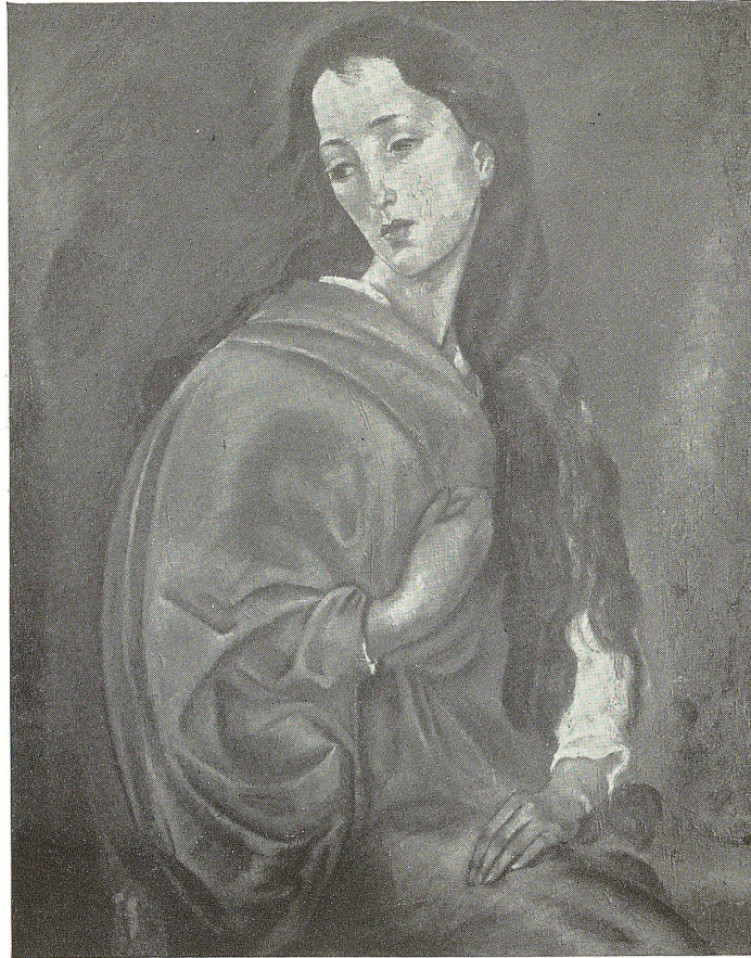
Melancholie. Nach einem Gemälde von Theo Glinz , St. Gallen