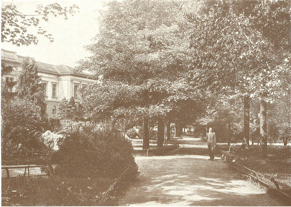
Partie aus dem Stadtpark mit Kunstmuseum.