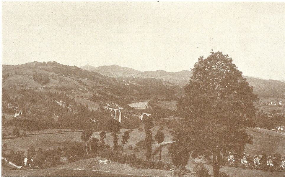
Ausblick von der Haggener-Höhe auf den Viadukt der B. T.-Bahn und den Gübfenmoosweiher