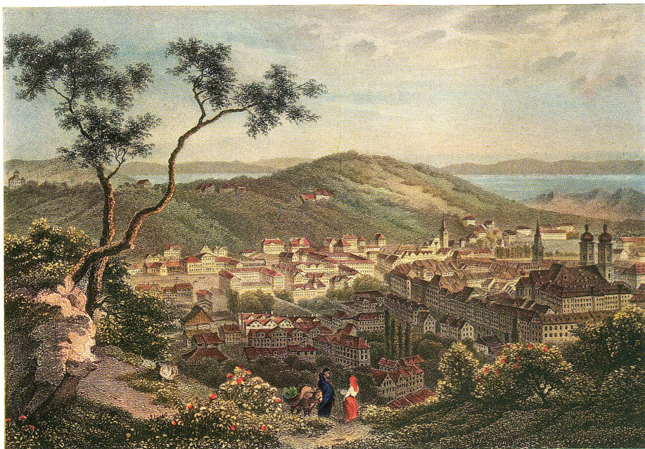
Die Stadt St. Gallen vor ca. 75 Jahren Nach einem handkolorierten Stahlstich von L. Rohbock-Poppel

Vierfarbendruck der Buchdruckerei Zollikofer & Cie. in St. Gallen