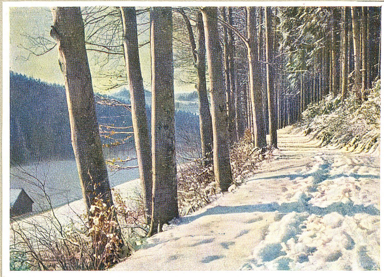
Im Tal der Demut

Nach einer farbigen Naturaufnahme von A. Klee