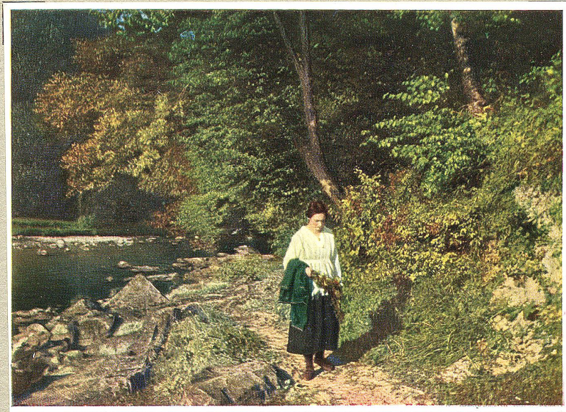
An der Sitter

Nach einer farbigen Naturaufnahme von A. Klee