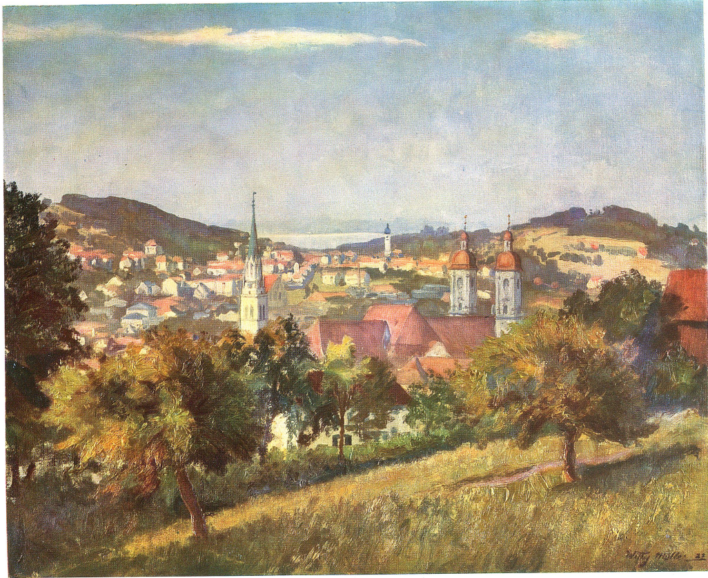
BLICK AUF DIE STADT ST. GALLEN VON DER BERNECK AUS Vierfarbendruck nach einem Oelgemälde von Willy Müller, St. Gallen

Buchdruckerei Zollikofer & Cie., St. Gallen