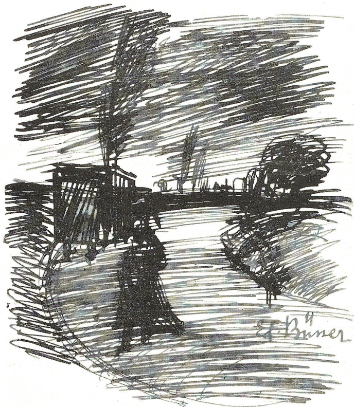
Sturm auf der Landstrasse.

Der Winter nimmt seinen Anfang, wenn die Sonne in das Zeichen des Steinbocks tritt, um Mittag den grössten Abstand vom Scheitelpunkt hat und so den kürzesten Tag hervorbringt, d. i. am 22. Dez., 3 Uhr 4 Min.