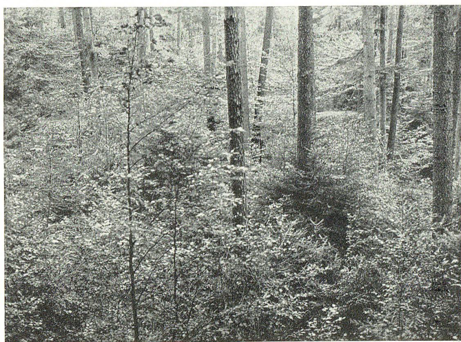
Schöne natürliche Verjüngungsgruppen von Buchen und Tannen im Staatswald Hättern bei St. Gallen.

Mit der Zunahme der Bevölkerung, der Vergrößerung alter und Gründung neuer Siedelungen (z. B. wurde 1091 Rapperswil im Wald gegründet), schrumpften die großen Waldkomplexe immer mehr zusammen. Axt und Feuer halfen das Vernichtungswerk an den undurchdringlichen Wäldern fördern. Ortsnamen wie Rüti, Schwand, Brand usw. erinnern an die großen Rodungen jener Zeiten. In den übrig gebliebenen Waldungen konnten sich die Leute für Haus, Hof und Herd Holz holen, soviel sie brauchten. Allmählich wurde der Wald auf die schlechteren Bodenpartien zurückgedrängt; aber auch dort setzten ihm Freihieb und Kahlschlag stark zu. Unvermeidliche Folgen dieser Mißwirtschaft waren Rutschungen, Derrüfungen und Überschwemmungen. So versumpfte z. B. das einst blühende Gelände zwischen Walen- und Zürichsee infolge unvernünftiger Kahlschläge im Einzugsgebiet der Linth derart, daß die Gesundheit der Bewohner stark gefährdet war: (Schuler, Glarnergeschichte) »Noch leben viele Landleute, die von ihren Vätern die Schönheit und Fruchtbarkeit des Landes zwischen der Linth und dem Walensee beschreiben hörten . . .« und später, nach den periodischen Überschwemmungen des gleichen Gebietes, heißt es in einem Bericht