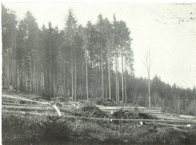
Kahlschlag in einem Privatwald. Raubbau an Boden und Bestand!

In grauer Vorzeit, wo Wolf und Bär einander die Beute streitig machten, waren Deutschland und die Schweiz, so berichten schon Julius Cäsar (eine Wald- und Sumpffläche von über 60 Tagemärschen in der Länge und 9 Tagemärschen in der Breite) und nach ihm Tacitus ums Jahr 100 n. Chr. (». . . Große, undurchdringliche Wälder und Sümpfe bedeckten das Land . . .«), dicht mit Wald bewachsen. Als Gallus, unseres Kantons Schutzpatron, seine Zelle am Steinacherufer zimmerte, und in der Folge in der näheren und weiteren Umgebung derselben der Wald (er hieß damals Arbonerforst und reichte von der Salmsach bis zum Weißbad, Appenzell, dann der Wasserscheide zwischen Sitter und Rhein entlang bis zum Monstein bei Au und hinunter an den Rhein und Bodensee) gerodet wurde, waren