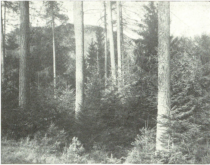
Natürliche Rottannenverjüngung unter Lärchenschirm im Gebirgswald.

u. a. (Römer, ... landschaftliche Veränderungen im unteren Linthgebiet):