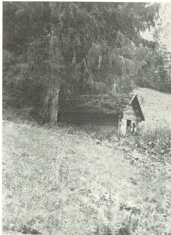
Gehrenhüttli, Ortsgemeinde Valens.

Noch wäre viel vom St. Gallerwald zu berichten, allein der zur Verfügung stehende Raum reicht nicht aus, alle Punkte zu berühren. Ich möchte aber nicht schließen, ohne den großen Wunsch auszu-