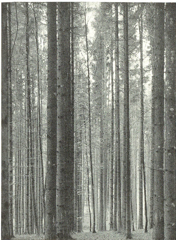
Reihenweise gepflanzter Rottannenbestand.

W ald! Welch großes, geheimnisvolles Zauberwort! Groß ist die Fülle von Schönheit und Freude, welche der Wald uns zu geben imstande ist. Ein Griesgram, der sich an ihm nicht freuen kann! Des Waldes Wert als Erholungsstätte der hastenden Menschheit, als Gesundbrunnen der Kranken und Schwachen ist kaum zu bemessen. Eng verknüpft sind Wald und Menschenseele. Ist es deshalb verwunderlich, wenn Dichter und andere Meister der Feder