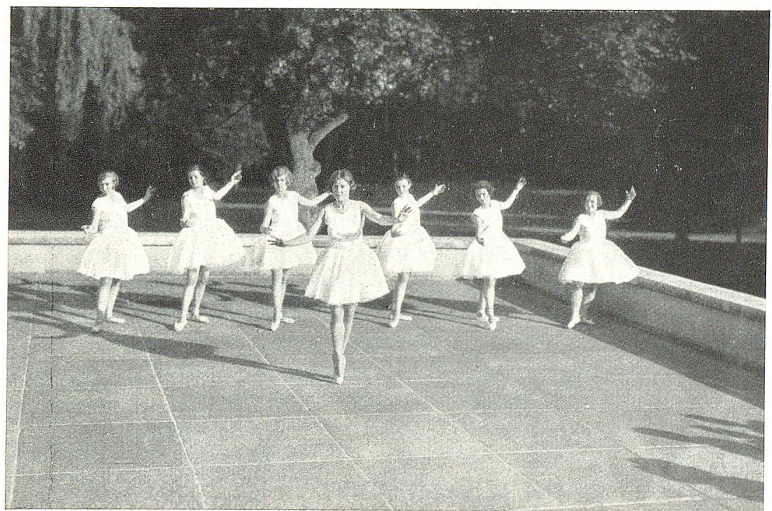
Spitzentanz; Parkfest 1928 in St. Gallen.