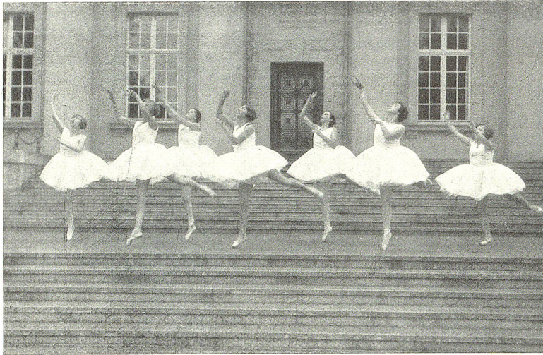
Ballett: Parkfest 1928 in St. Gallen.

Seine Renaissance ist aus dem Osten gekommen, und wer je einmal Diagilew gesehen hat, weiß, daß das Ballett neu auferstanden ist. Niemand wird ernsthaft behaupten können, daß ihm das künstlerische Moment fehle und daß es nur Technik sei. Die Pawlowna ist heute noch die große Prima des Balletts, und Diagilew ist ein Meister so gut wie Laban; er ist mehr intuitiv, weniger Intellekt. Und am Ende ist intuitiv gebrachte Kunst der stärkste Ausdruck des seelischen Erlebnisses im tänzerischen Menschen. So wird der intuitiv schaffende Mensch in der Kunst auf die Dauer nie verdrängt werden können vom intellektuellen; denn in jenem schlummert die Kunst als Talent.