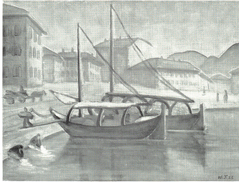
VENEDIG. Nach einem Gemälde von W. Thaler, St. Gallen.