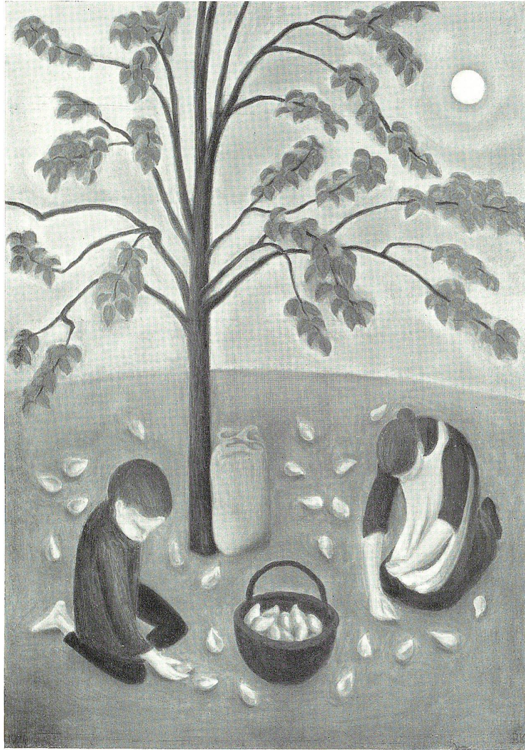
HERBST. Nach einem Ölgemälde von Bruno Kirchgraber, Gais.