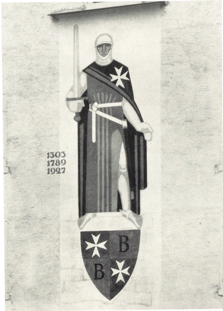
Façadenbild am Bubikonerhaus (Johanniter) in Rapperswil von Aug. Wanner, St. Gallen