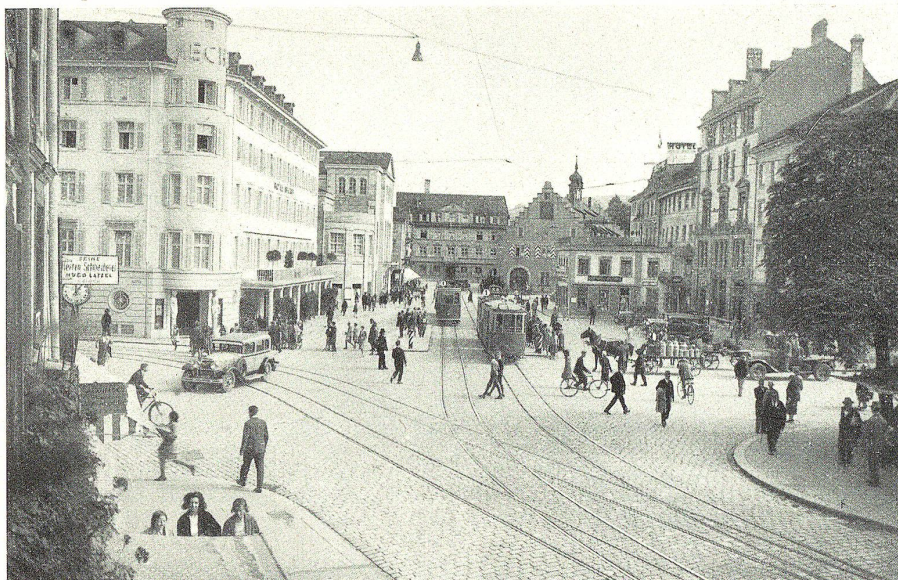
Der Marktplatz in St. Gallen

REDIGIERT UND HERAUSGEGEBEN VON AUG. MÜLLER, ST. GALLEN