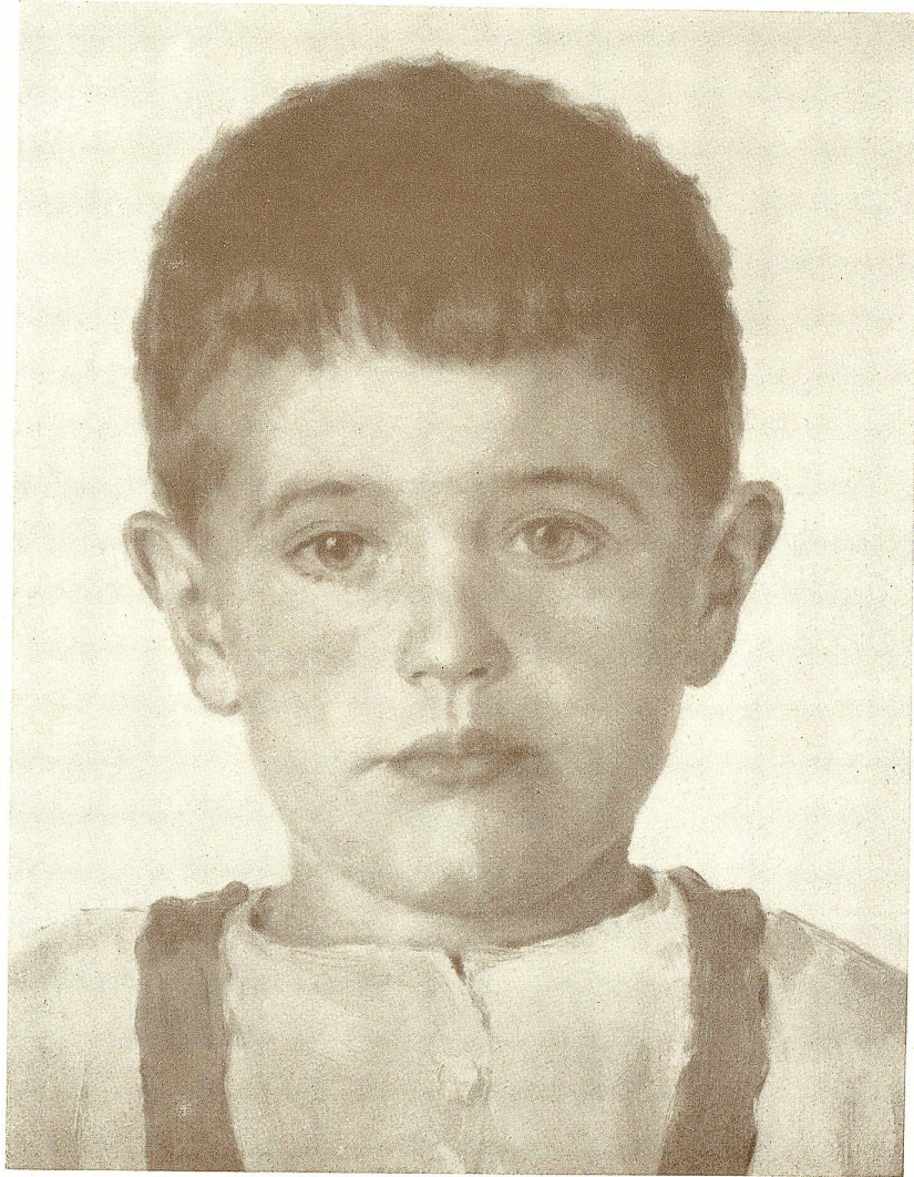
KNABENBILDNIS. Gemälde von E. Schmid, Heiden