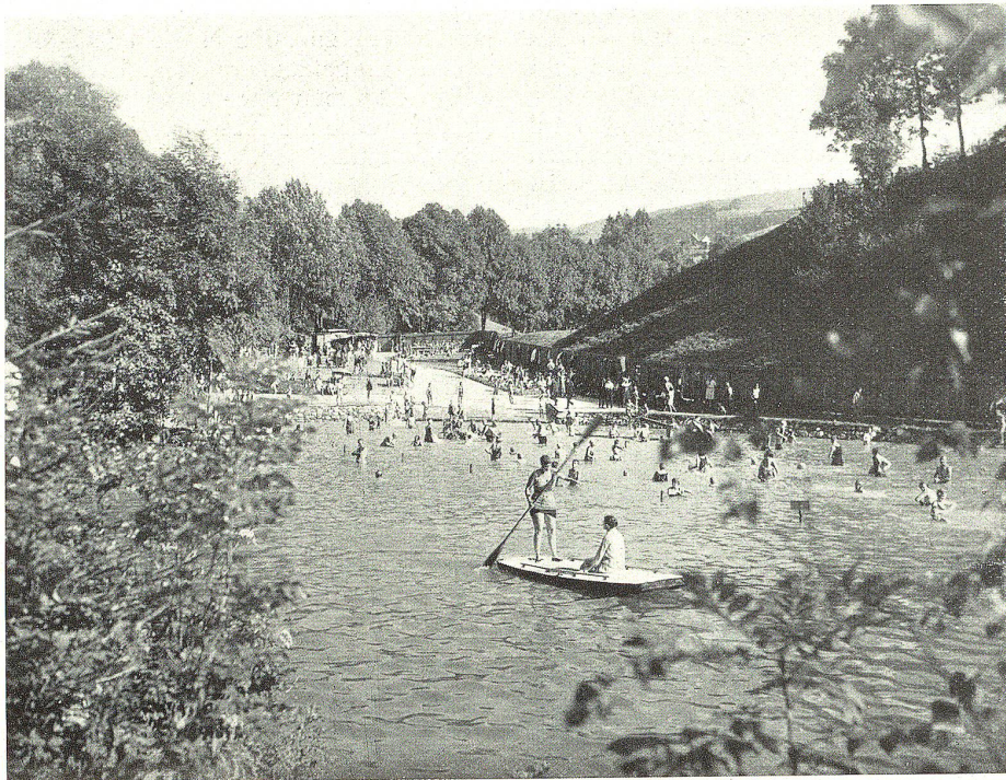
Das neue Trogener Schwimmbad

Weißer hindurch das Goldachwasser abgeleitet werden kann. Der Zufluß des ganzen Baches würde die Badetemperatur auch im Sommer zu tief halten; so aber kann dem Weißer selber eine regulierbare Menge Frischwasser zugeführt und bei Regenwetter vermieden werden, daß das dann trübe Wasser den Weißer verschlammte. Die ganze Anlage, welche Vielen willkommene Arbeit brachte, ist in drei Monaten erstellt worden. Bei den Bauarbeiten sind nicht nur