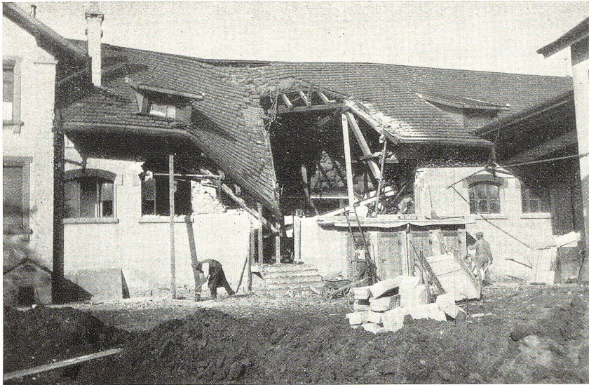
Das eingestürzte Gebäude der Kühlhaus A.-G. in St. Margrethen