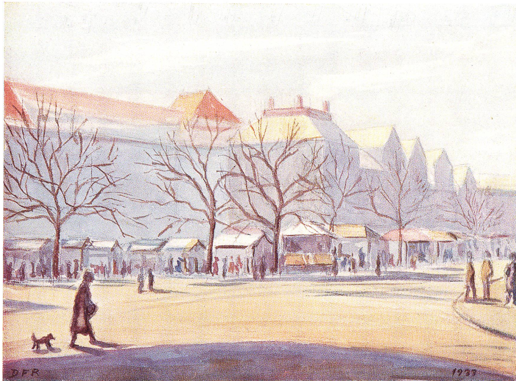
Der Marktplatz in St.Gallen vor der Umgestaltung Nach einem Aquarell von Dora F. Rittmeyer