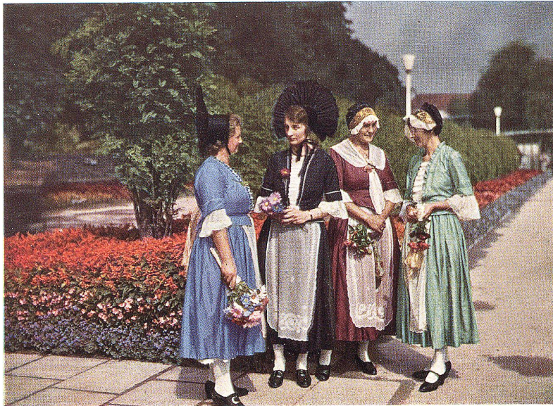
Rapperswilerinnen an der „Züga“