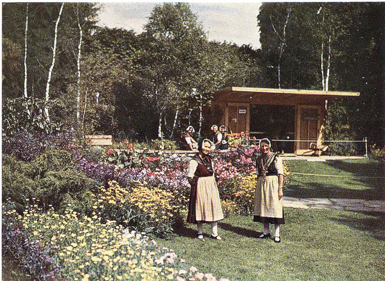
Sondergarten W. Leder, Zürich