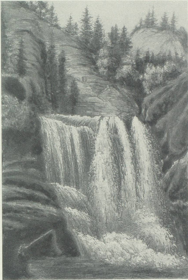
Der Rothfall bei Teufen. Le Rothfall près de Teufen.

brochen oder Schlipfe niedergegangen sind. Daß diese Überraschungen nicht nur Unheil anrichten, erfuhren meine Frau und ich in unserer Brautzeit.