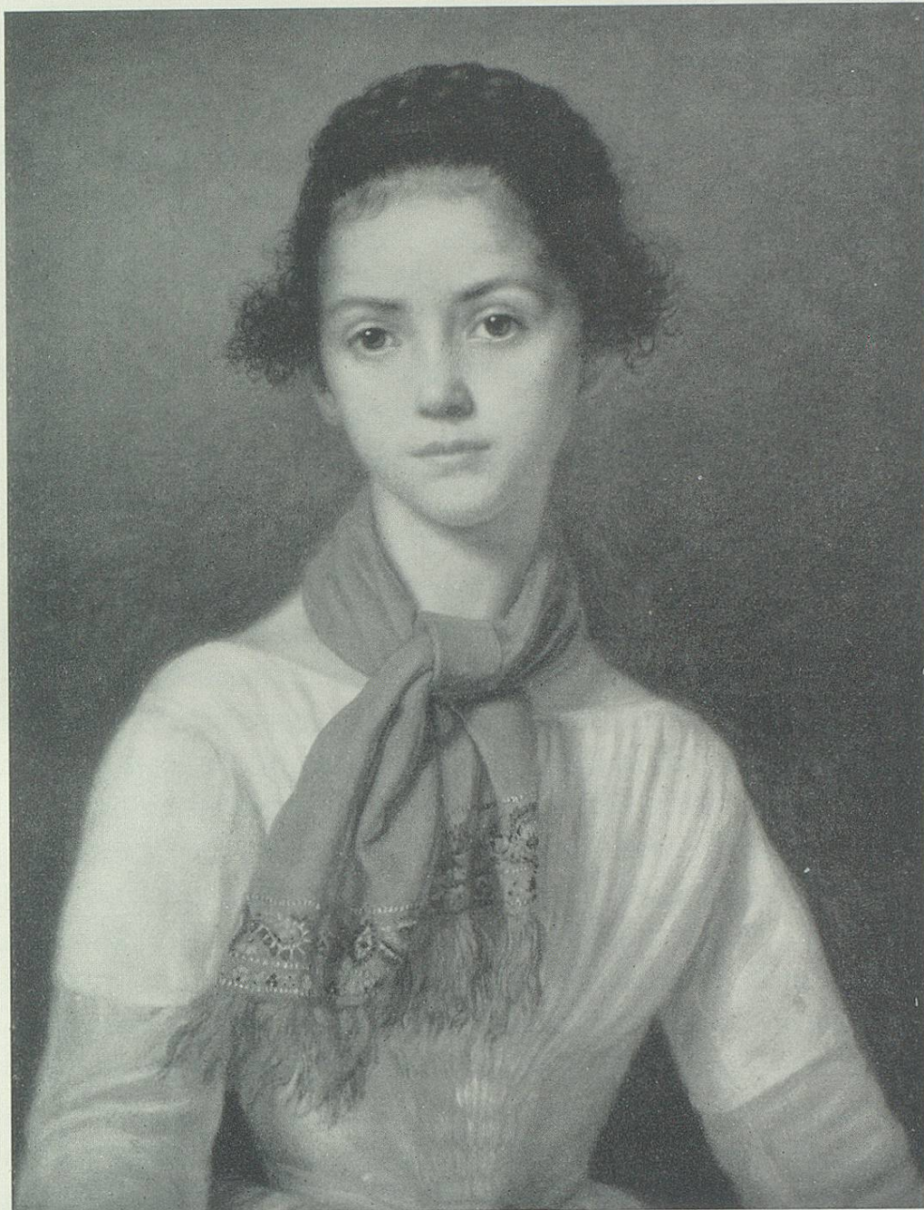
Johannes Mettler: Bildnis eines jungen Mädchens (Kunstmuseum St.Gallen)

Zu diesen Werken gehört das Bildnis eines unbekanntem jungen Mädchens im Kunstmuseum St.Gallen. Die Dargestellte, an der schwebenden Grenze zwischen Kindheit und