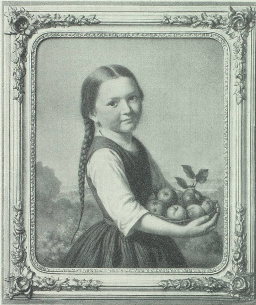
Johannes Mettler: Kinderbildnis (im Besitz von Frau L. Nef-Mettler, St.Gallen)

cheln von Mund und Augen gleich wieder vergessen wird. Der Früchtekorb scheint übrigens weniger nach der Natur entstanden als von einem Gemälde Caravaggios angeregt 14 . Ein zweites Kinderbild stellt einen Knaben mit langem, blondem Haar dar – neben dem vergnügten Bauernmädchen eher ein Stadtkind, auf das Hauslehrer und frühe gesellschaftliche Verpflichtungen warten 15 .