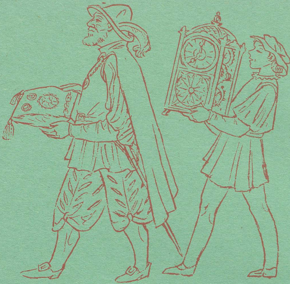
Uhrmacher und Goldschmied

Früher war das Meisterstück der Ausweis des « zünftigen » Meisters. Heute sind alle Stücke, die unser Geschäft und unsere Werkstätte verlassen, Meisterstücke, von der genauen Uhr bis zum anspruchsvollsten Schmuckstück.