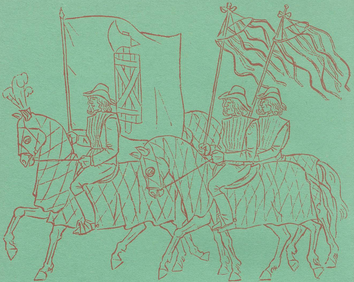
Reiter mit Kantonsbanner und Maibäumen

Unter dem Banner des Kantons, das schon das erste Anstaltswappen von 1855 zierte, begann die « Creditanstalt in St.Gallen » ihre Tätigkeit. Sie gehörte zu den frühesten « Vorreitern » des Kreditwesens und ist seither bestrebt geblieben, als selbständiges und nützliches Glied der sanktgallischen Wirtschaft zu wirken.