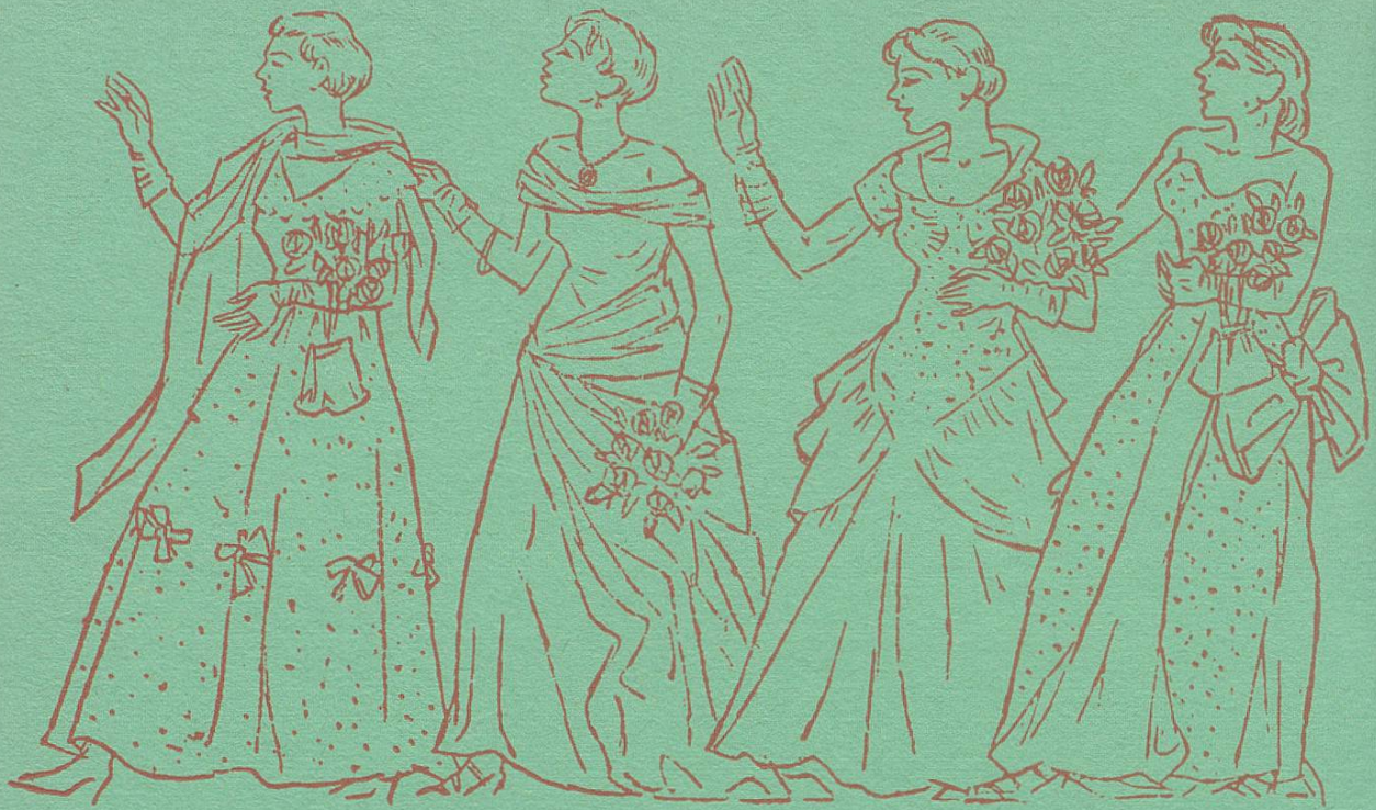
Mode in Weiß

St.Gallen wird immer die Modestadt in Weiß bleiben. Daß aber auch die Farben, die Stoffe, der Schnitt und alles Modische zur Geltung kommen, das zeigt Ihnen am deutlichsten unser altbekanntes Geschäft.