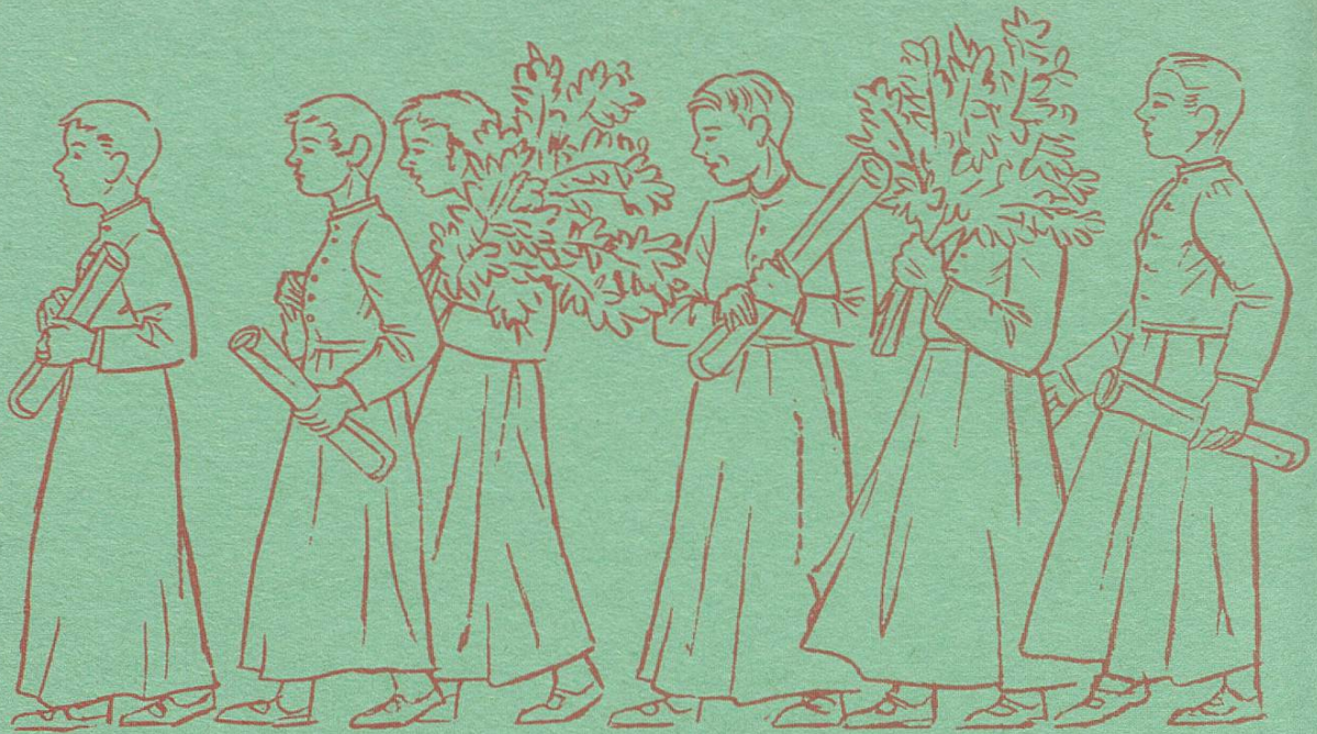
Zöglinge der Benediktinerschule

Was früher mühsam auf unvergängliches Pergament geschrieben wurde, wird heute in Millionenzahlen gedruckt und geschrieben. Das Wort und mit ihm das Papier ist eine Weltmacht geworden.