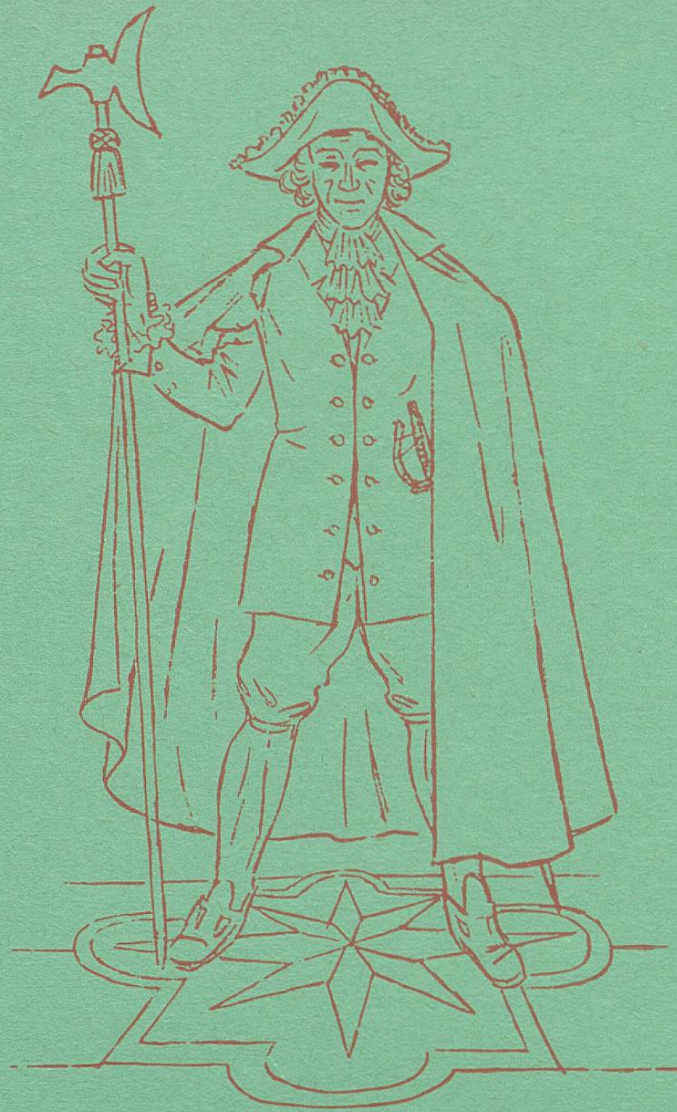
Herold aus dem Gefolge des Glarner Landvogtes zu Werdenberg

Wie oft mag dieser Herold in der eigenen Residenz, oder am Regierungssitz fremder Häupter, seinen Herrn auf prächtigem Parkettboden angemeldet haben. Heute noch, mit erweiterten Möglichkeiten, wird Parkett verlegt. Der erfahrene Parkettier wird Ihnen gerne raten.