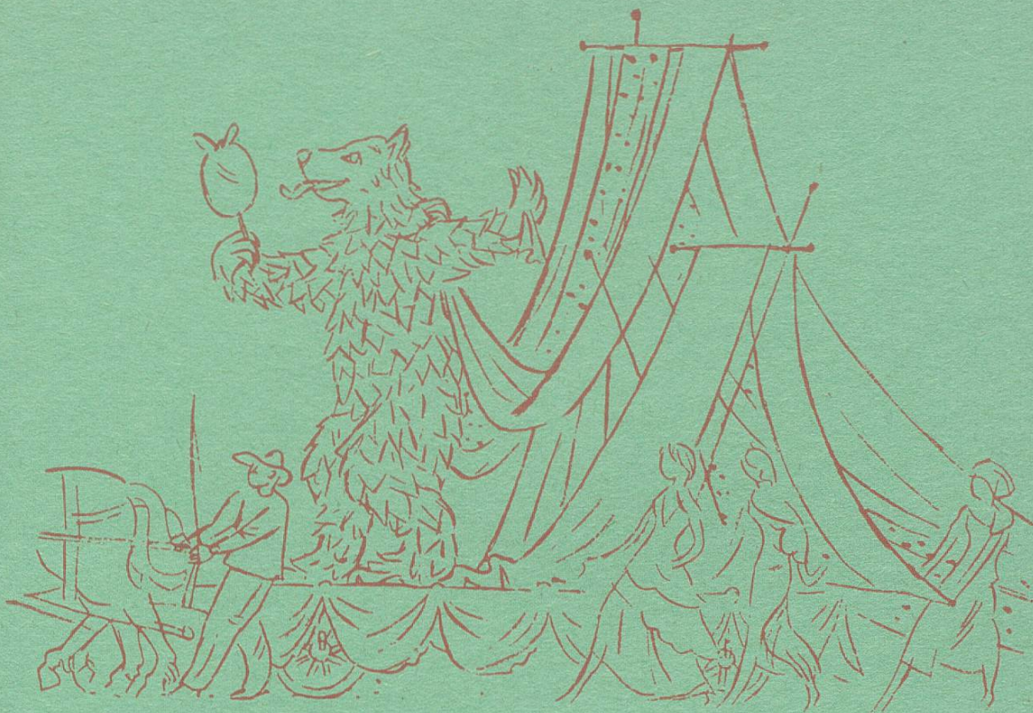
Modewagen des Kaufmännischen Directoriums

Der Modewagen war das Spiegelbild sanktgallischen Textilschaffens. Das Spezialgeschäft macht es sich zur Ehre, immer das Allerneueste der letzten Mode zu Ihrer Auswahl bereit zu halten.