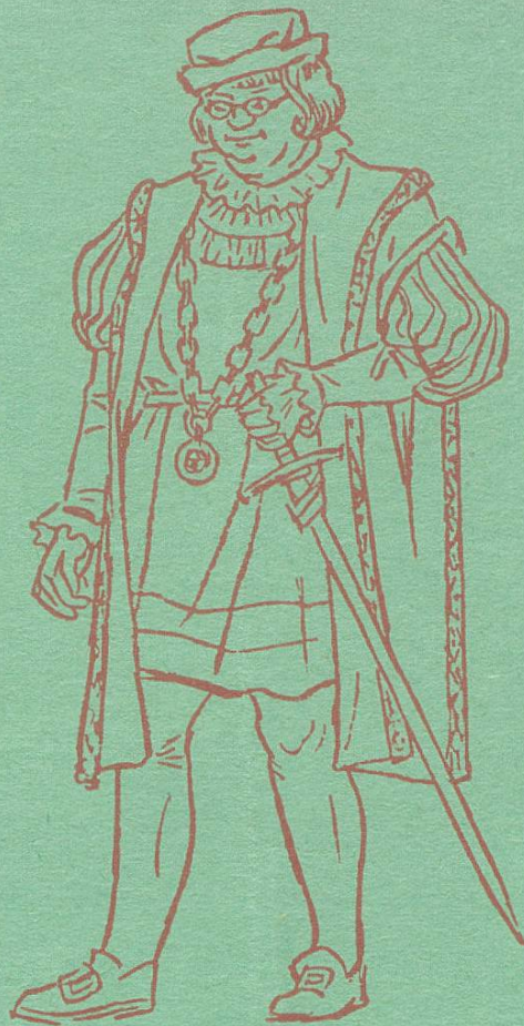
Zunftmeister zur Webern

Optiker, Brillen- und Instrumentenmacher waren auch dazumalen gesuchte Handwerker. Die heutigen Anforderungen an unsern Stand bedingen allerdings ein viel höheres Wissen. Zum Wohle der Mitbürger stellt der diplomierte Fachmann sein Können zur Verfügung.