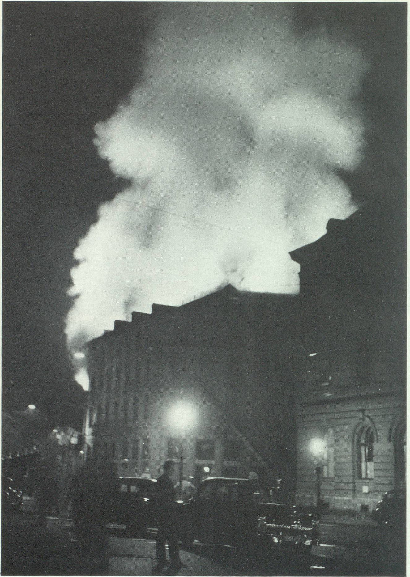
In der Nacht vom 12. auf den 13. Juli zerstörte ein Brand das Hotel Walhalla