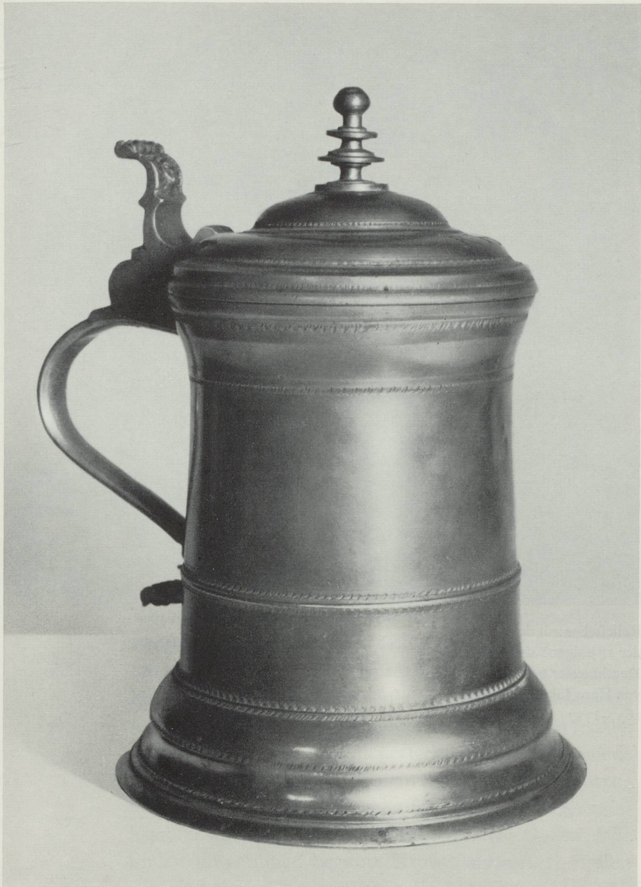
Deckelkrug, Höhe 15,5 cm von Johannes Reutiner, 1636–1699