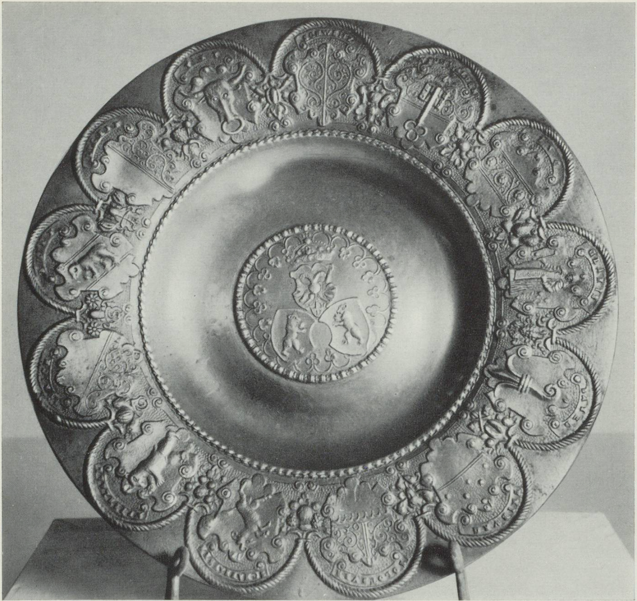
Reliefteller mit den Wappen der 13 eidgenössischen Orte, Durchmesser 21,5 cm, von Hans Jakob Schirmer, 1657–1727