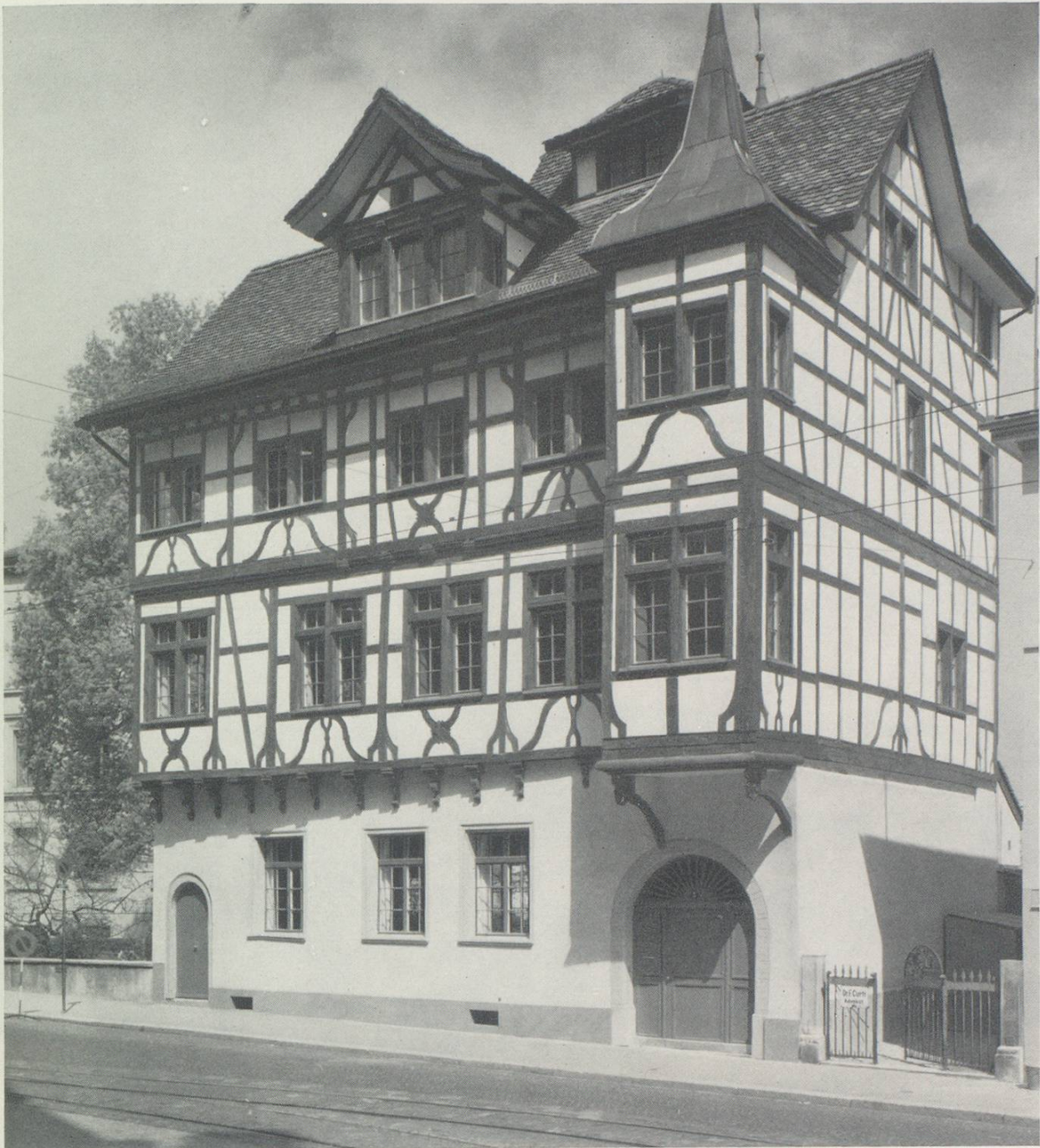
Links und oben: Haus zur «Hechel» am Burggraben