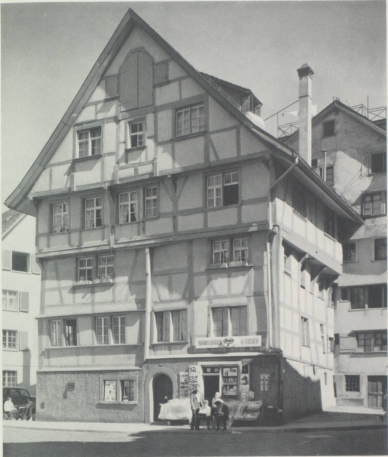
Haus zur «Linde» am Gallusplatz