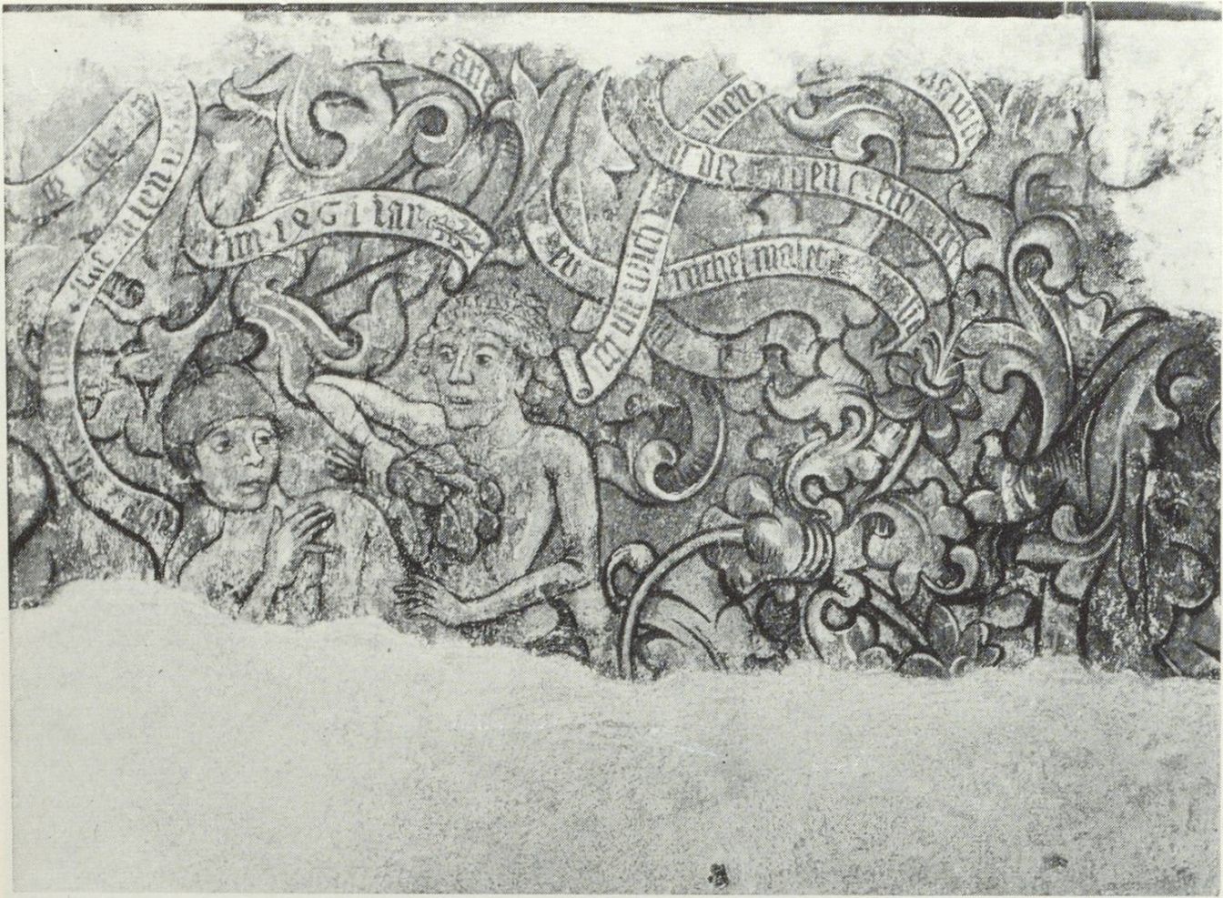
Ein Detail des Freskos vom Hause «Zum liegenden Hirsch» Spisergasse Nr. 41