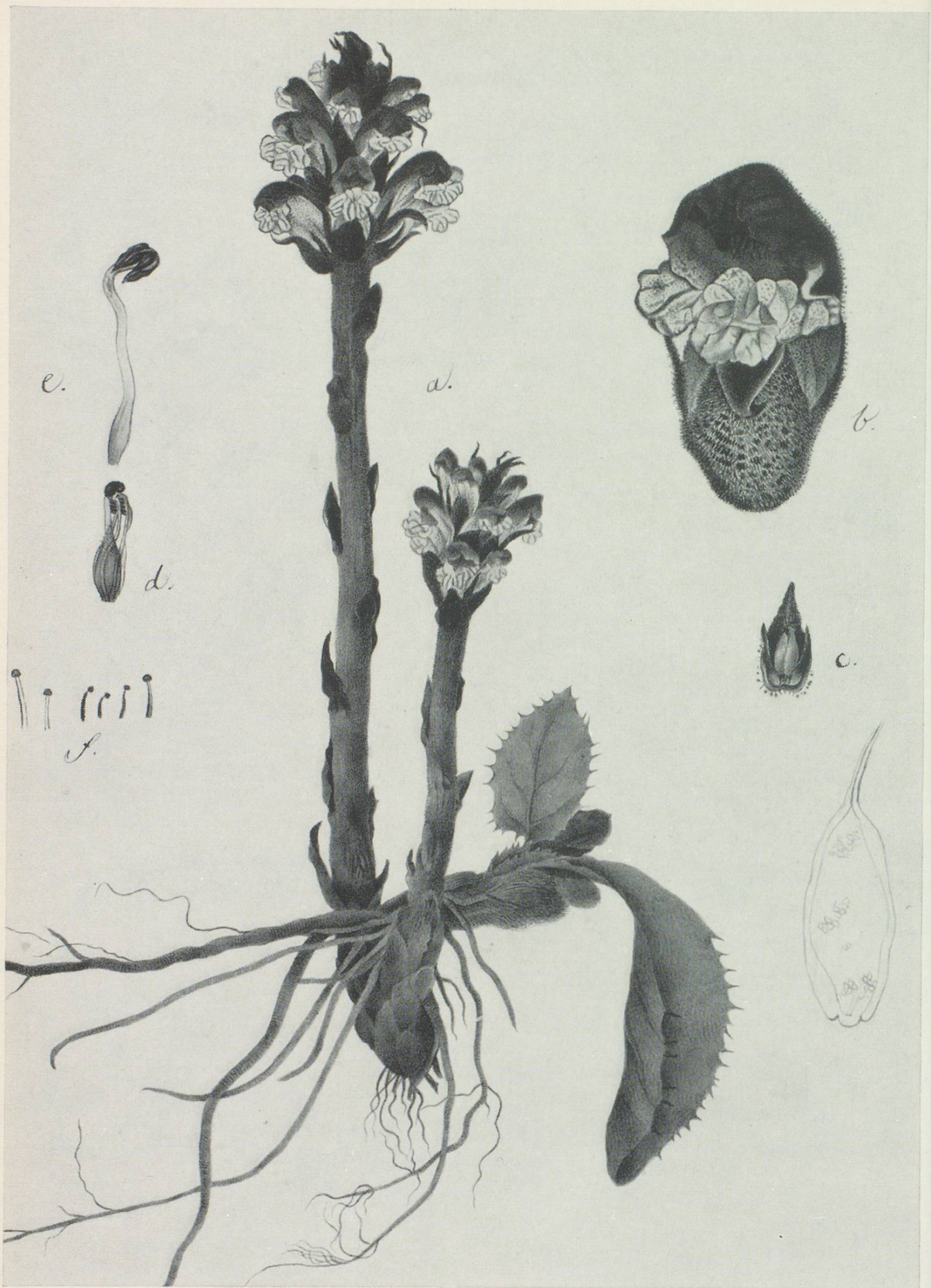
Sommerwurz ( Orobanchaceae scabiosae Koch), ein Schmarotzer, der ohne eigenes Blattgrün andern Pflanzen Säfte raubt, indem er ihre Wurzeln anzapft.