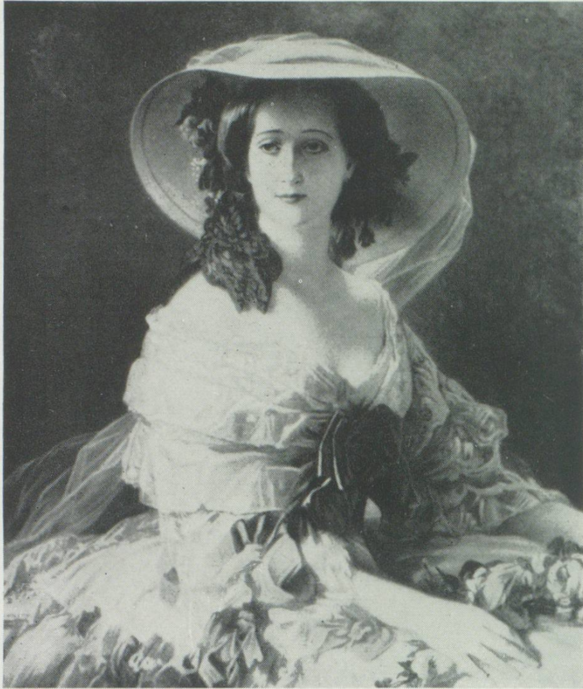
LA BELLE EPOQUE

erreichte ihren Höhepunkt um die Jahrhundertwende, also zur Gründungszeit unserer Firma. Wir waren denn auch schon damals in der Lage, unserer Damenwelt die neuesten Modeschöpfungen vorzuführen, und das verschaffte uns den guten Ruf für auserlesenen Geschmack und beste Qualität.