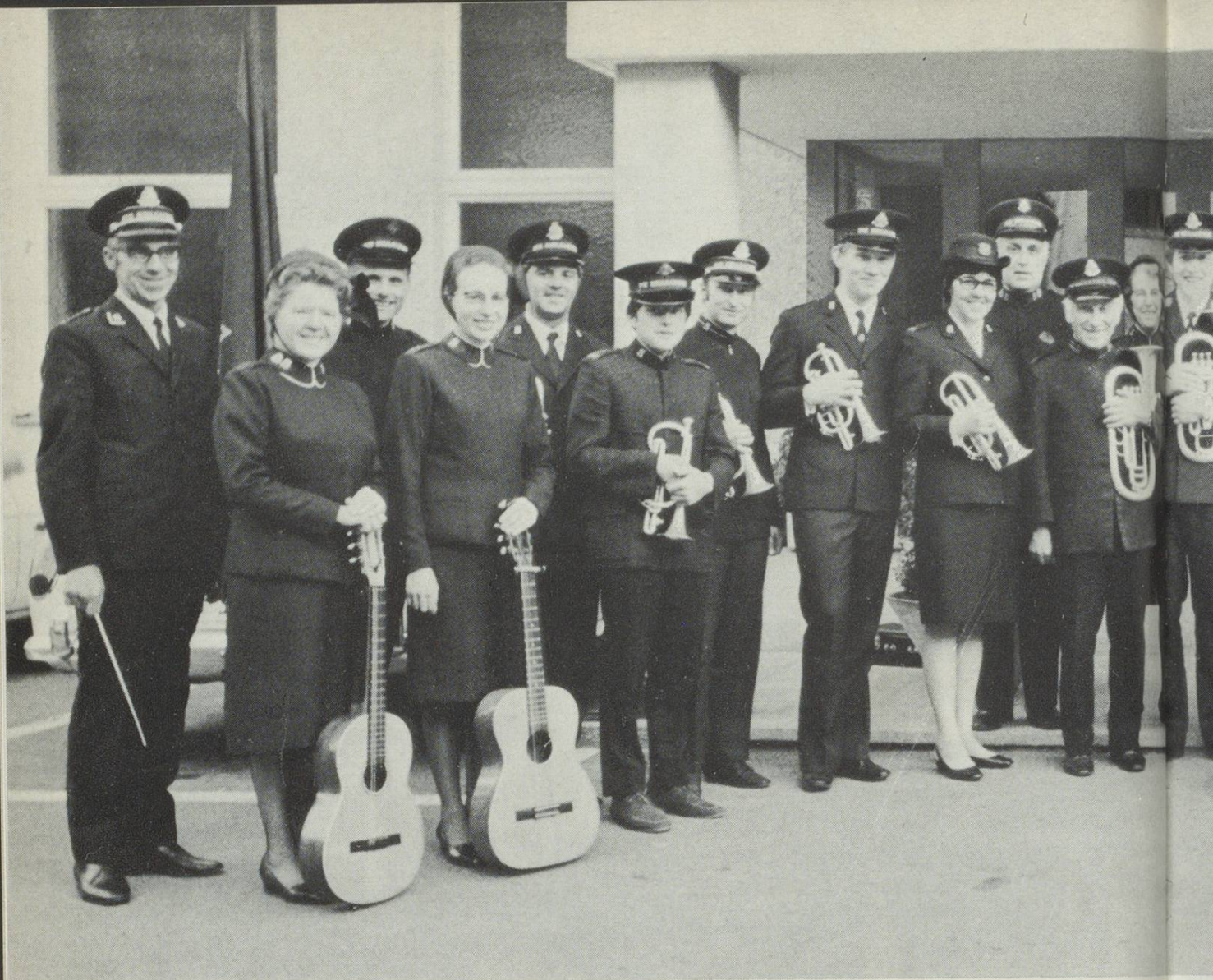
Oben: St.Galler Salutisten vor dem Eingang Links: Relief von Bildhauer Max Bänziger Rechts: Wirtschaftsbrigade «im Einsatz»