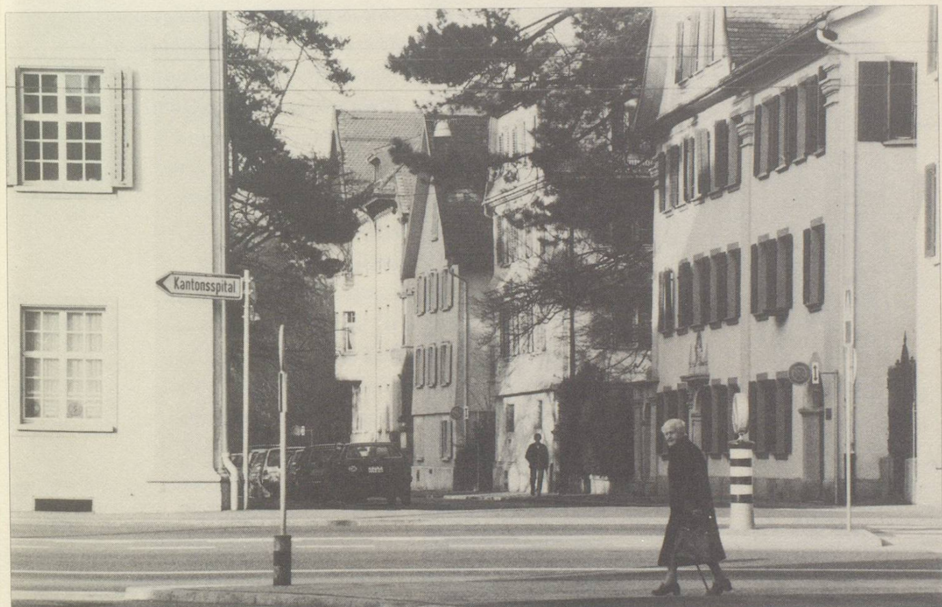
Die herrschaftlichen barocken Häuser an der Greithstrasse erinnern an die äbtische Vergangenheit.