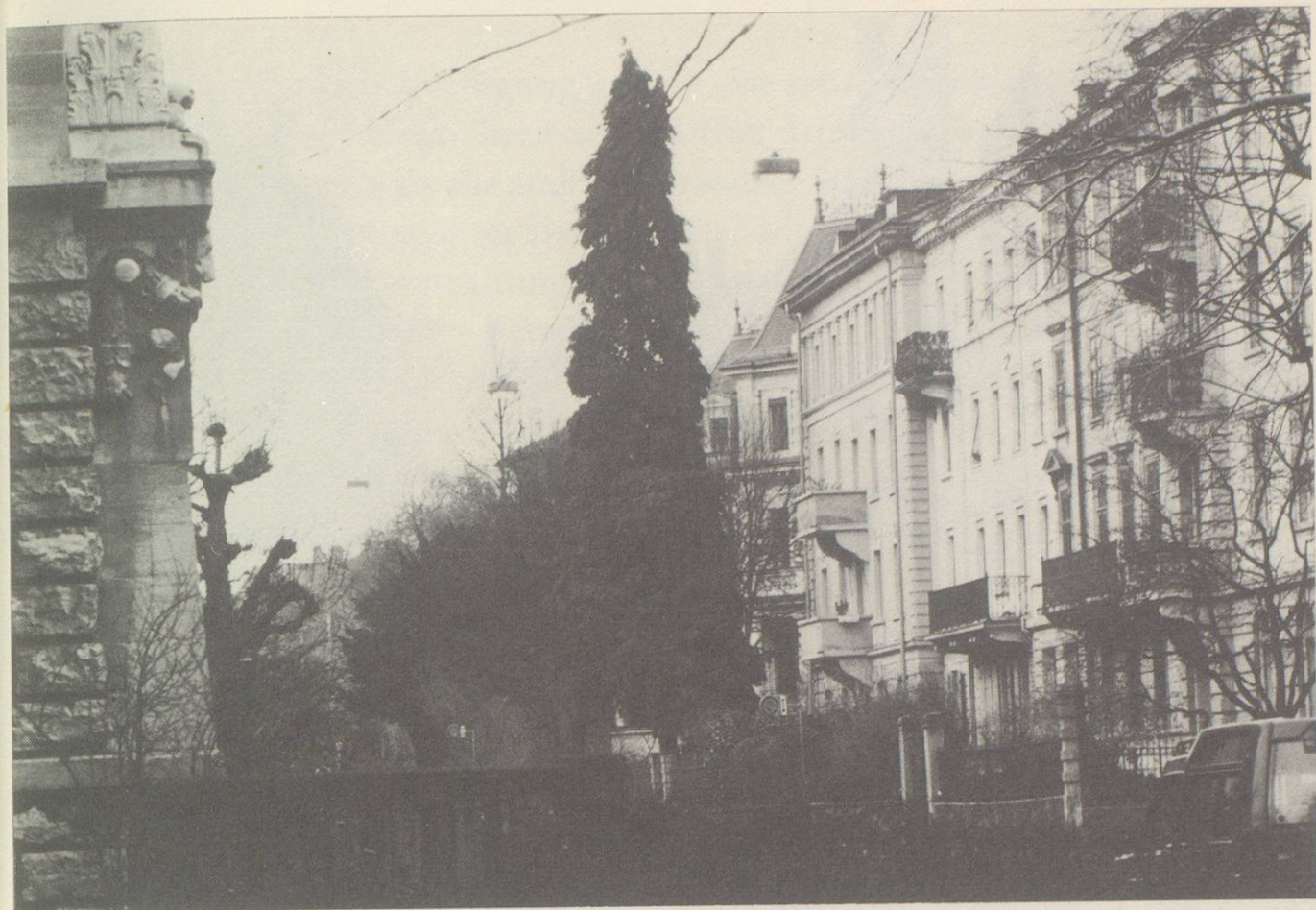
Im geschützten Ortsbild spielen viele Elemente eine Rolle: Vorgärten, Bäume, Mauern, Gartentore, Treppen, Balkone, Strassenbeläge . . . Als Beispiel: Notkerstrasse im zentrurnahen Museumsquartier.