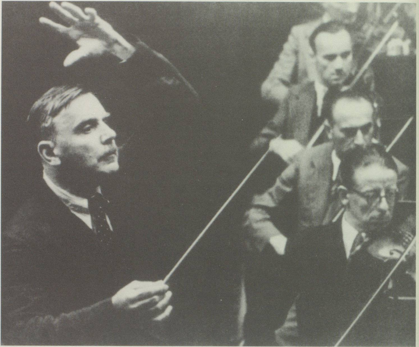
Energiegeladen, engagiert – so bleibt Schoeck als Dirigent in Erinnerung. Aufnahme aus einer Probe in der Zürcher Tonhalle, etwa aus dem Jahre 1920.