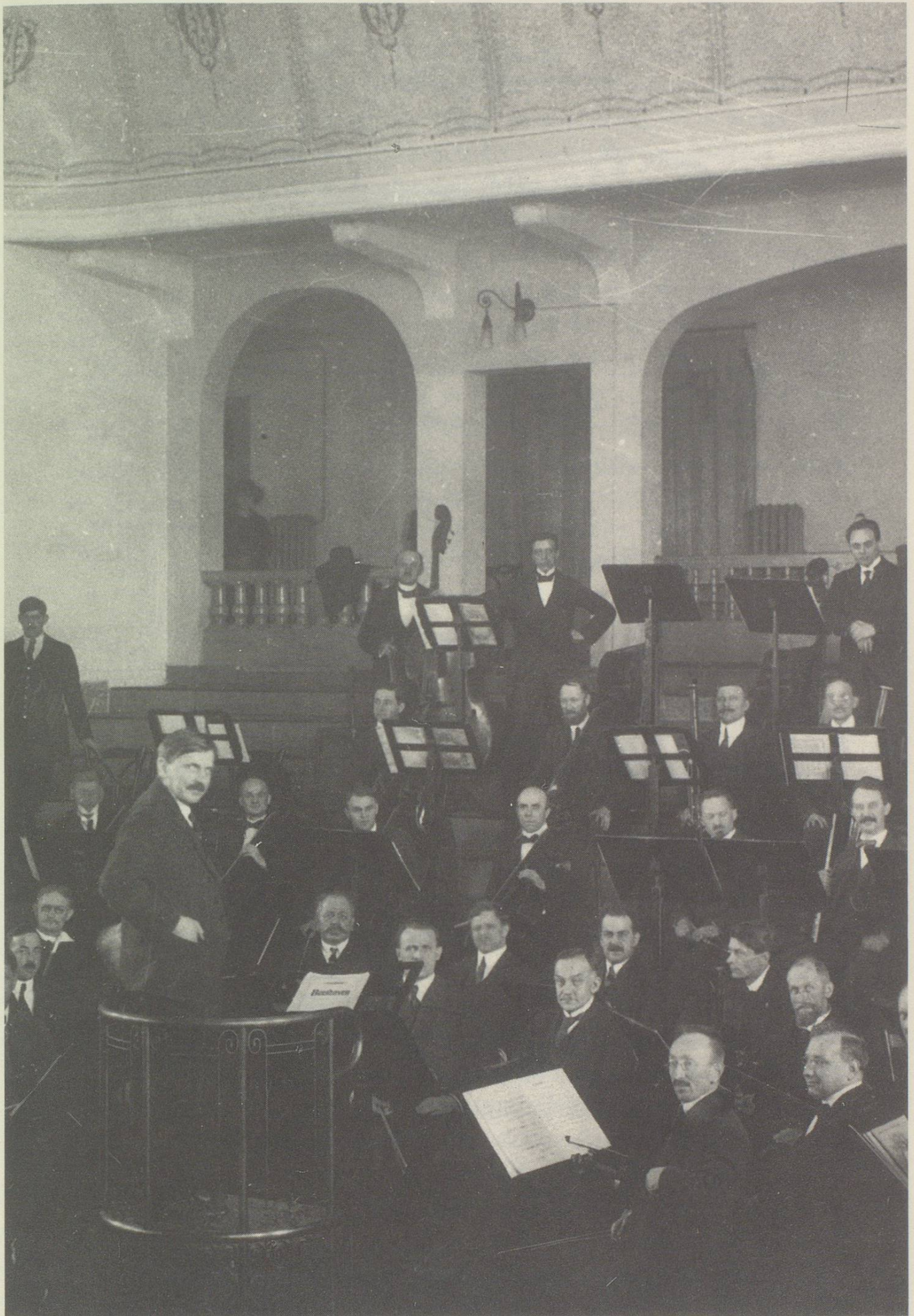
Othmar Schoeck in den zwanziger Jahren mit dem St.Galler Orchester in dem Haus, das nun durchgreifend renoviert wird.