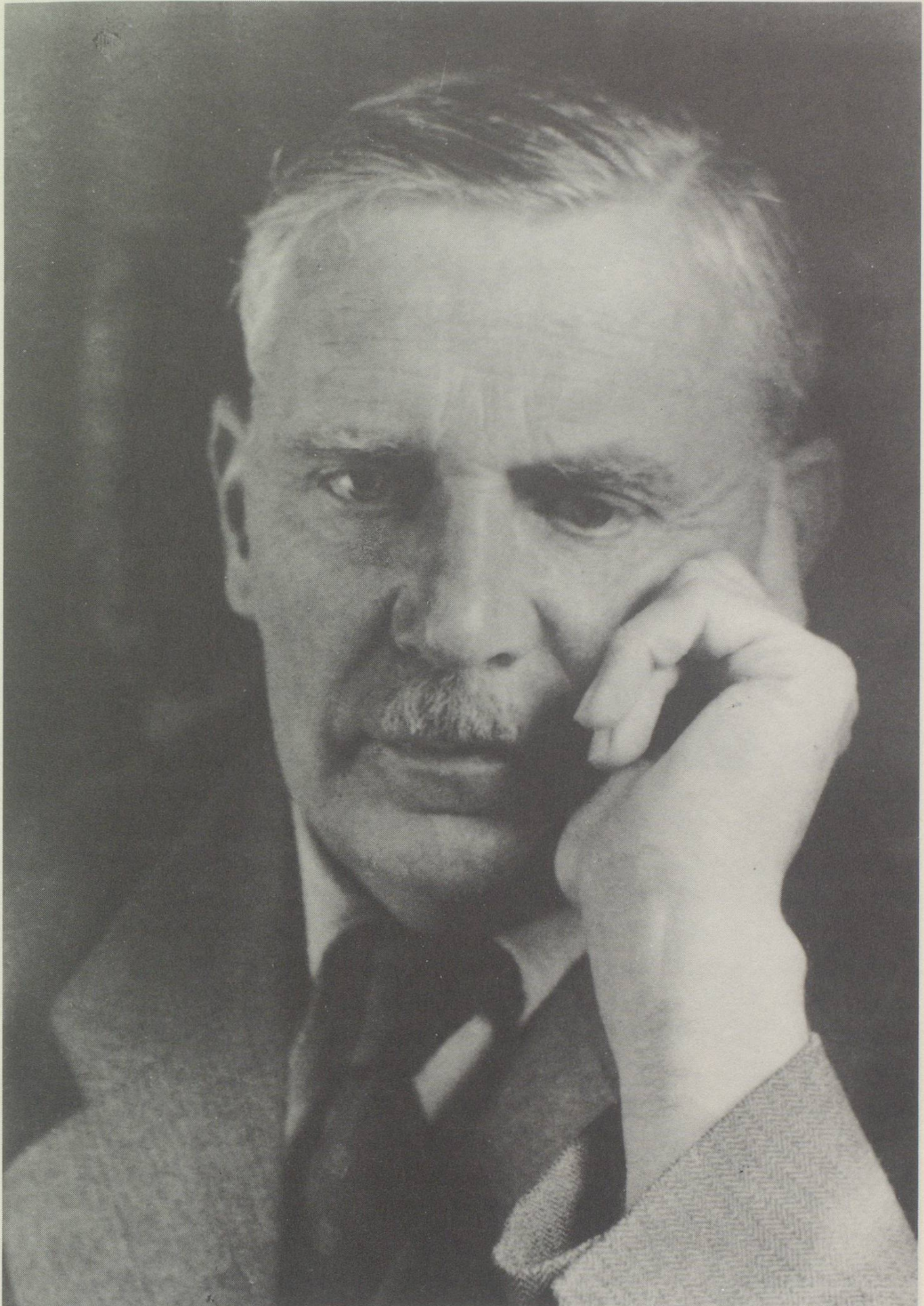
Der Komponist Othmar Schoeck, aufgenommen im Jahre 1946.